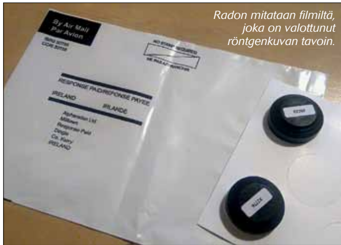
Radon mitataan filmiltä, joka on valottunut röntgenkuvan tavoin.