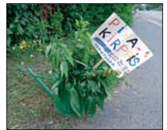
Joku oli innostunut pitämään kirpparia samalla kertaa koko viikonlopun.