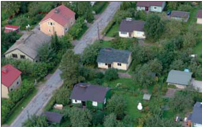
Radonmittaus tehtiin Nekalan Ruotsalaishälsän.

ka valmistuivat 1939–1940. Kuten muuallakin Viinikka-Nekalan alueella, tonttimme maapohja on tiivis savi. Kuntotarkastuksessa 2000-luvun alussa tarkastaja luuli mittarinsa olevan rikki, kun tilat olivat erittäin kuivat ja toisellakin mittarilla tulos oli sama. Radonmittaustulokset tulivat aikanaan käytyään tutkittavana aina Irlannissa asti. Molemmat tulokset olivat reilusti vanhojen talojen toimenpidearvojen alapuolella, maanpäällinen kerros vain 20 Bq/m 3 ja alakerta 150 Bq/m 3 .