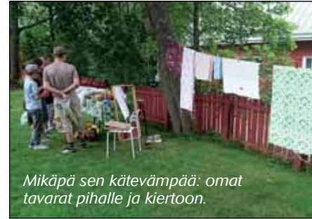
Mikäpä sen kätevämpää: omat tavarat pihalle ja kiertoon.