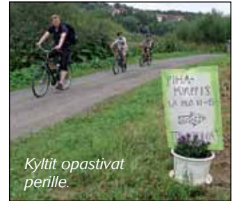
Kyltit opastivat perille.