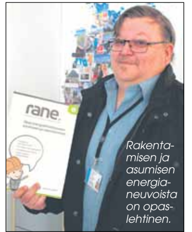
Rakentamisen ja asumisen energianeuvoista on opaslehtinen.

Ekokumppaneiden energianeuvojat tekevät perusteelliset selvitykset 180 eurolla. Markkinoilla energiatodistuksesta joutuu mak-