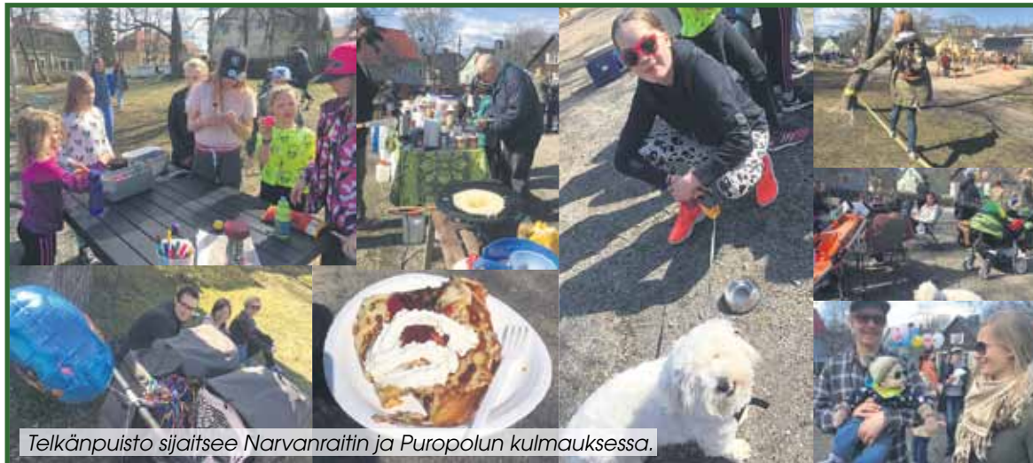
Telkänpuisto sijaitsee Narvanraitin ja Puropolun kulmauksessa.