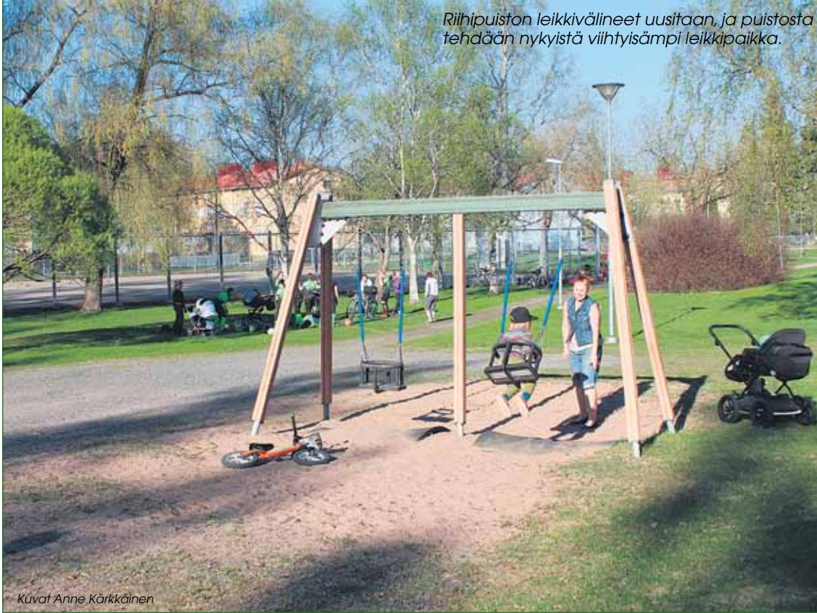
Riihipuiston leikkivälineet uusitaan, ja puistosta tehdään nykyistä viihtyisämpi leikkipaikka.