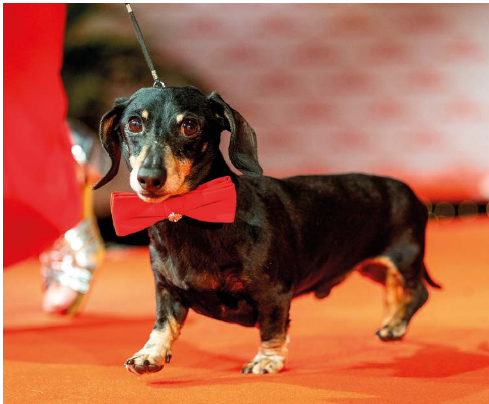
Ulkoasuun on panostettu.