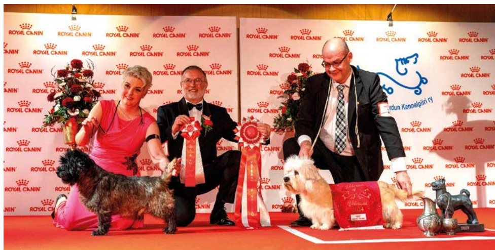
VETERAN OF VETERANS dandiedinmontinterrieri Dariant Egypt. Runner Up: Cairnterrieri Sanderfield Sky Diver