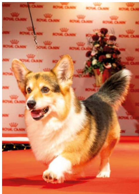
Gaalan vanhin welsh corgi pembroke Promi- sheill No Greater Kiss 13,5v.