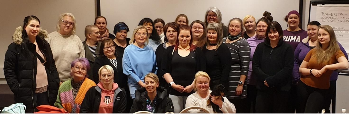
Kasvattajan jatkokurssi 2023. Osallistujia Etelä-Pohjanmaan Kennelpiirin alueelta 19 ja muualta Suomesta 11 (Kemijärvi-Lohja).