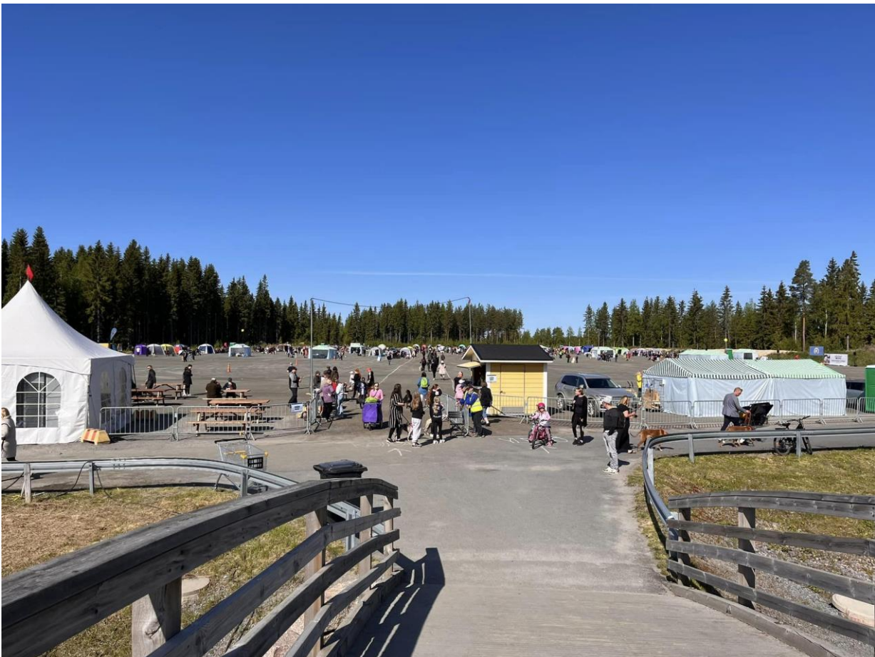
Miljoonakoira näyttelyn sisäänkäynti

Näihin tapahtumiin tarvitaan aina talkoolaisia. Jos sinua kiinnostaa tulla mukaan, ota yhteyttä rotusi jaoston puheenjohtajaan. Saat häneltä tarkemmat tiedot, minkälaisia tehtäviä on tarjolla.