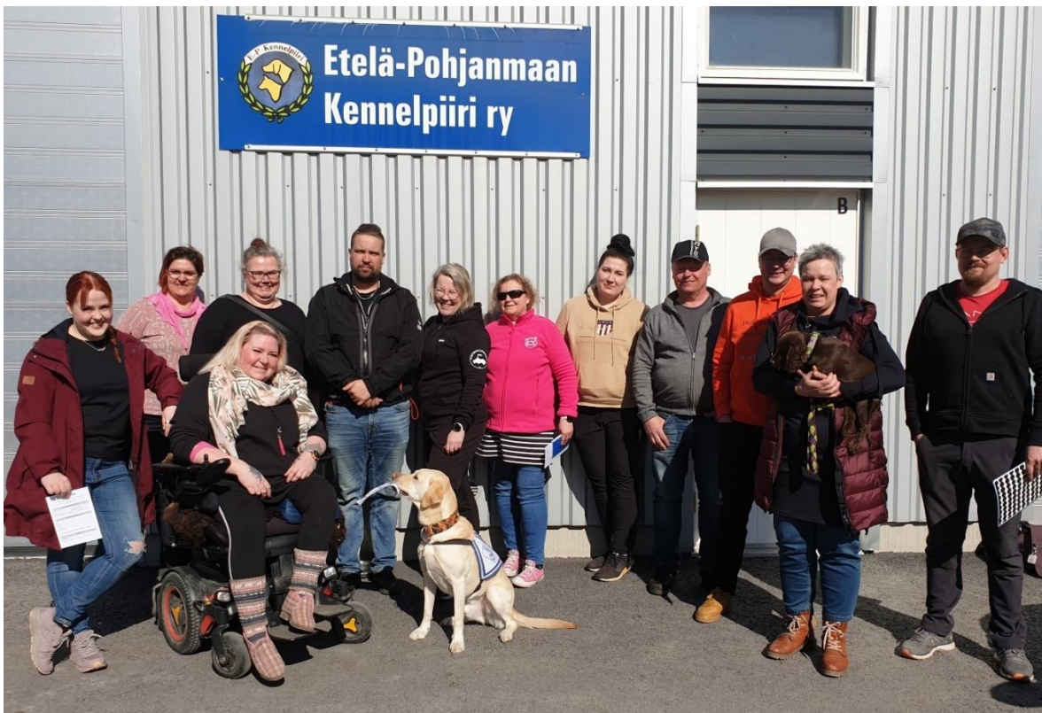
Koetoimitsijan peruskurssilaiset 15.4.2023

Etusija Etelä-Pohjanmaan ja Vaasan kennelpiirin alueilla asuvilla.