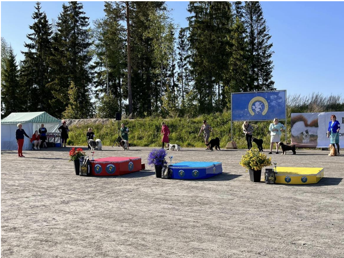
Tuurin näyttely viikonloppuna oli tänä vuonna kaksi erillistä näyttelyä. Perjantaina yksipäiväinen kaikkien rotujen näyttely sekä normaalisti lauantaina & sunnuntaina Miljoonakoira. Järjestelyt onnistuivat hyvin.