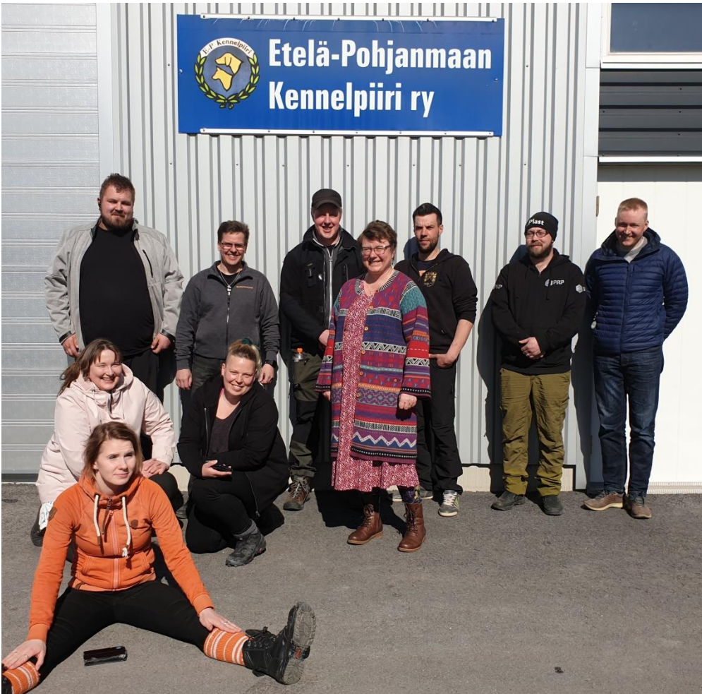
Ylituomarin peruskurssilaiset 16.4.2023.