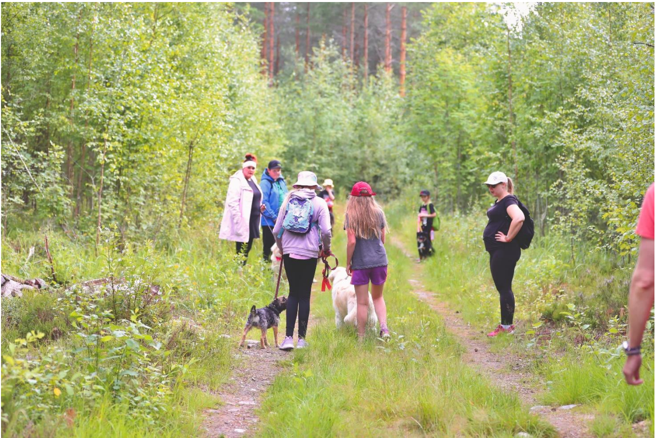
Nuorisojaoston retkeltä 27.7.2023.

Avustusanomukset lähetetään sihteerille ja puheenjohtajalle.