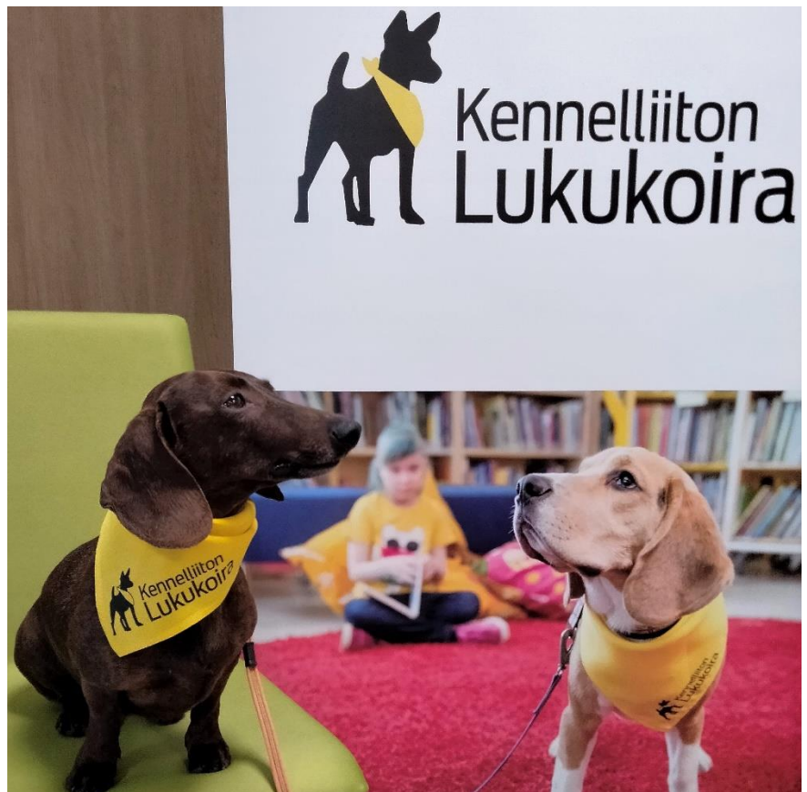
Toimintaan hyvin soveltuva Kiki sai kurssilla Kennelliiton lukukoirahuivin