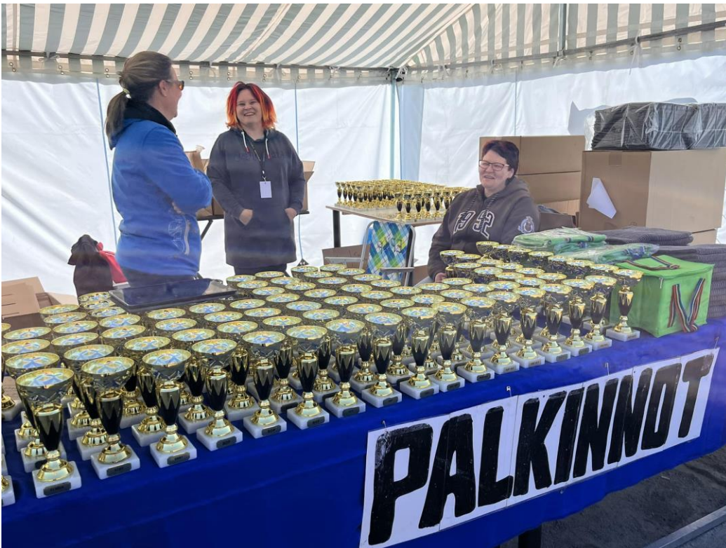
Miljoonakoiran palkintojen jakopiste.