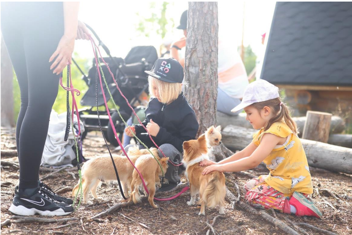
Nuorisajaoston retki-illasta.

Torstaina 27.7. järjestettiin nuorisajaoston retki-ilta. Mukaan saatiin ilahduttava määrä nuoria ja perheitä koirineen, osallistujia oli yhteensä lähes 20. Retkelle lähdettiin Seinäjoentien varresta Sahannevalta, josta taitettiin n. kilometrin mittainen polku Sauralaakson laavulle. Menomatalla koiria aktivoitiin erilaisilla tehtävillä, mm. kiipeilyllä ja kiepeillä, ja perillä tehtiin vielä namien etsintää metsämaastosta. Makkaran- ja vaahtokarkkien paiston lomassa nuoret saivat kuvauttaa koiriaan joko yhteiskuvissa tai yksittäin. Retki oli oikein pidetty ja sai paljon hyvää palautetta.