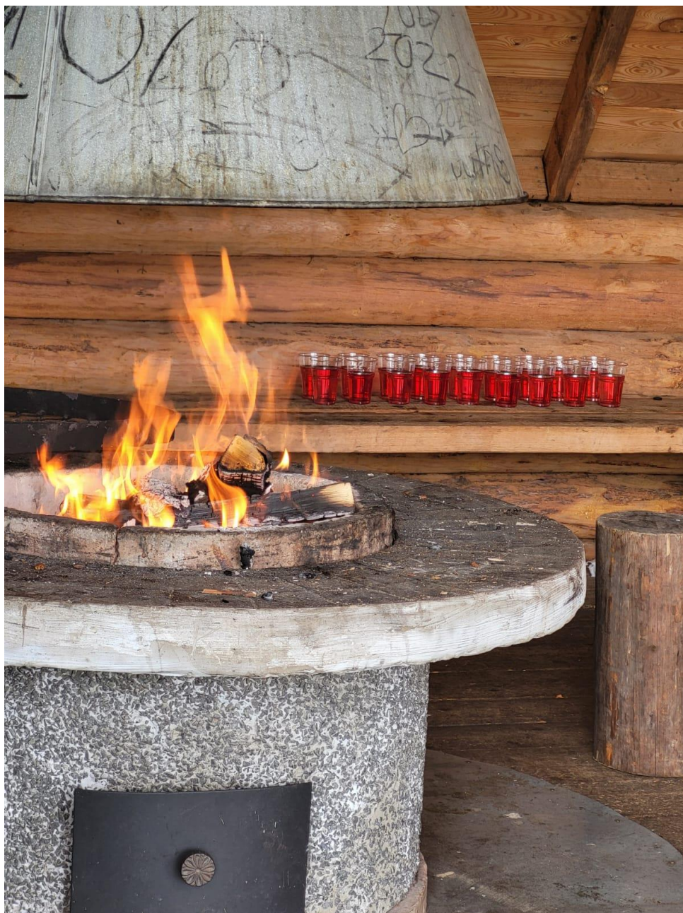
Nuorisajaoston retkeltä 27.7.2023.