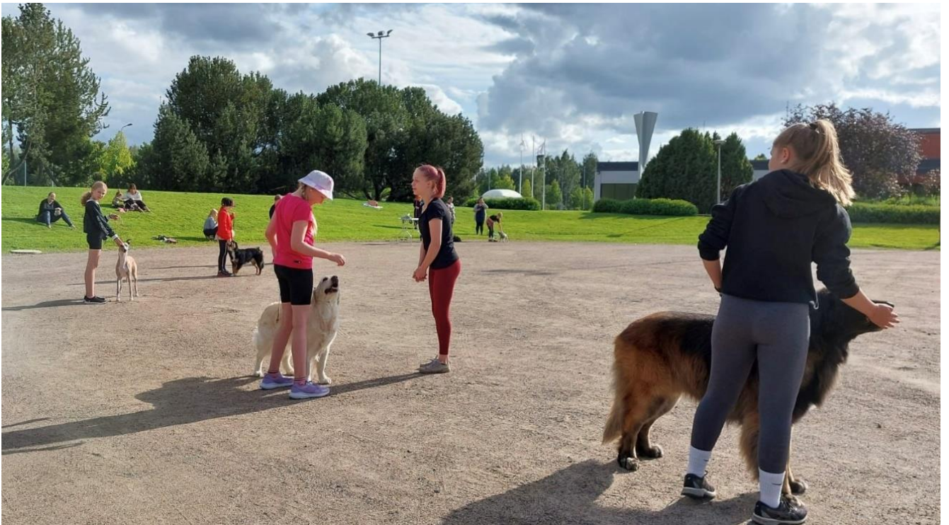
JH-Treeneistä.