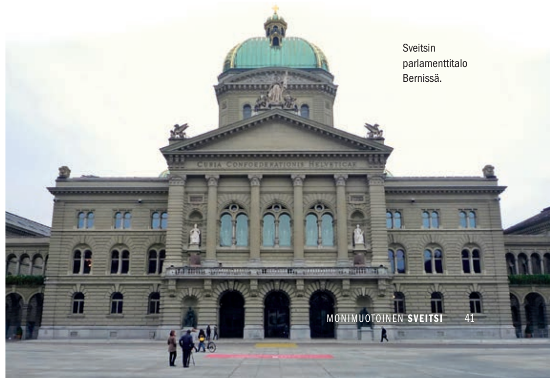
Sveitsin parlamenttitalo Bernissä.

Liittovaltio vastaa myös turvapaikkapolitiikasta ja kansaneläkelaitoksesta, rahoittaa kantonien paikallisliikennettä ja kantonien myöntämiä sosiaalitukia, sekä kerää arvonlisäveron ja luovuttaa osan valtionverosta kantoneille. Sveitsin keskuspankki (SNB) on itsenäinen päätöksenteossaan mutta luovuttaa osan voitostaan liittovaltiolle ja kantoneille. Suurin osa keskuspankin varoista on sijoituksina muiden eri valtioiden velkakirjoissa (63 %), ja lisäksi keskuspankilla on omia kultavarantoja n. CHF 7,3 mrd. arvosta (6 % v. 2019). Keskuspankin oman pääoman arvoksi arvioidaan CHF 170 mrd.