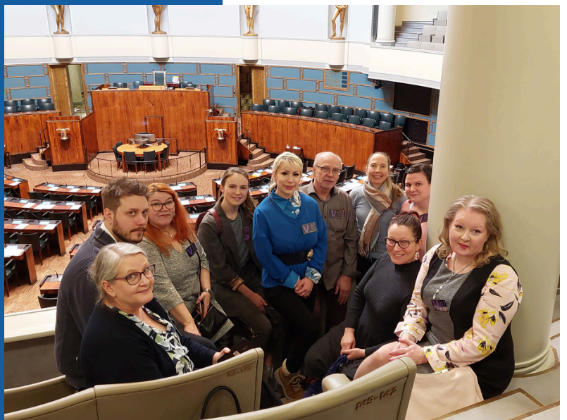
MYRY vieraili eduskunnassa myös keväällä 2023

Adressi ja siitä seurannut keskustelu oli merkittävä torjuntavoitto YELin suhteen, ja se epäilemättä pelasti tuhansien yrittäjien toimeentulon. Vaikka kyseessä oli nyt vain laiha kompromissi ja väliaikainen ratkaisu itse lain suhteen, jälkilausuma antaa kuitenkin toivoa YEL-järjestelmän kokonaisuudistamiseksi.