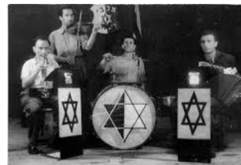
תזמורת במחנה דיבורלי - הארון טעמאל ספה אברסרביץ. א-2718/196