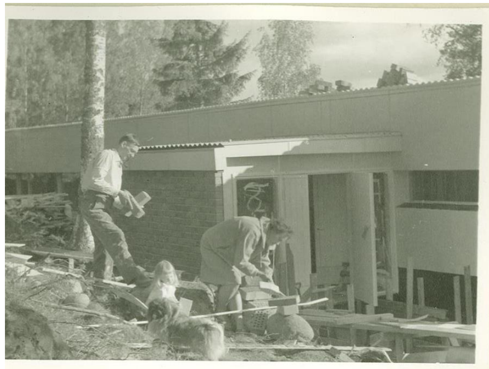
Työleiri Viittakiven opistolla Hauholla 1962