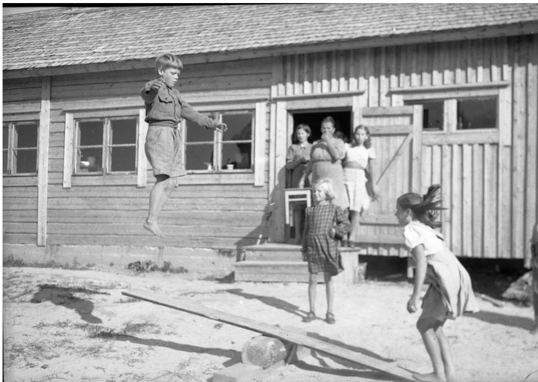
Lapin jälleenrakennusta 1948

Ne asiat, jotka meitä eri kattojen alla olevia ihmisiä yhdistävät, ovat suurempia kuin ne, jotka meitä erottavat