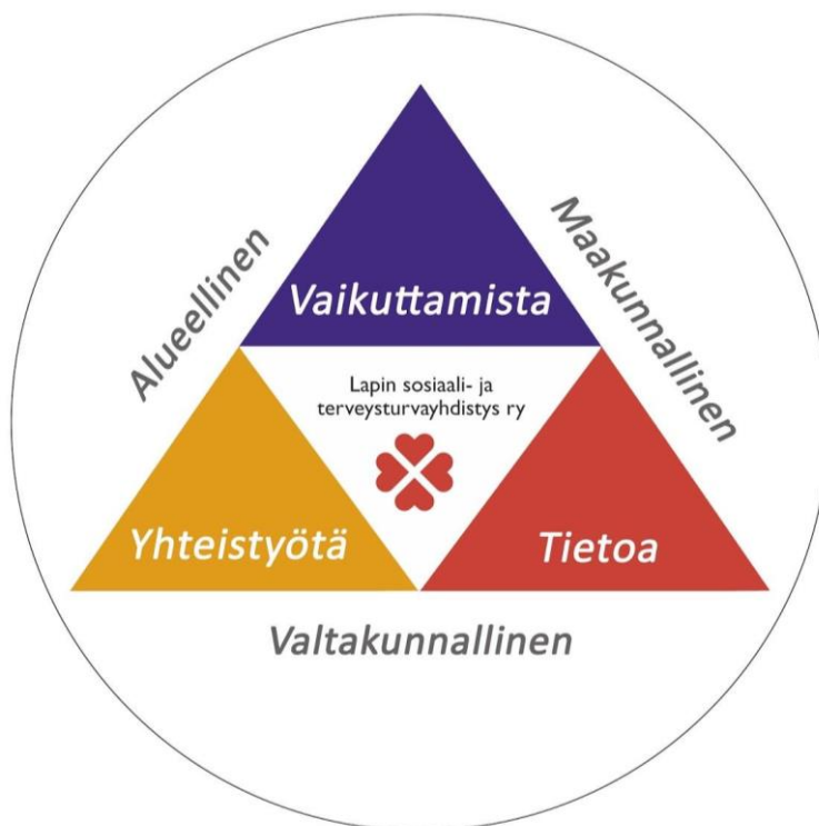
KUVIO 1. Lapin sosiaali- ja terveysturvayhdistyksen toiminnan painopisteet ja toimintakenttä.