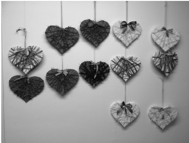
Kuvassa Simpukassa 21.11.2015 pidettyjen jouluaskartelumyyjäisten satoa.