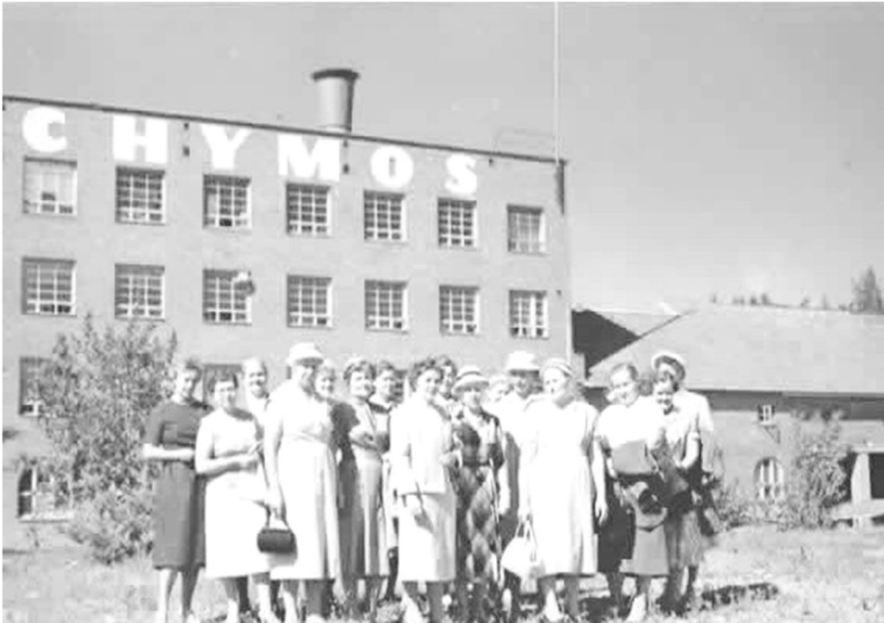
Vierailulla Chymoksen teollisuuslaitoksella.

Ulkomaan matkailu lisääntyi ja yhdeksi marttailtojen aiheeksi nousi matkakertomukset maailmalta. Matkailevat martat kertoivat kuvin ja sanoin käynneistään Bulgariassa, Ranskassa, Amerikoissa, Kreikassa, Teneriffalla, Italiassa, Sveitsissä ja Hollannissa. Lyhyemmille retkille kuten Kolmen Ristin kirkkoon, naapurikaupunkien uimahalleihin ja Lappeenrantaan Chymoksen teollisuuslaitokselle kaikki martat osallistuivat aktiivisesti.