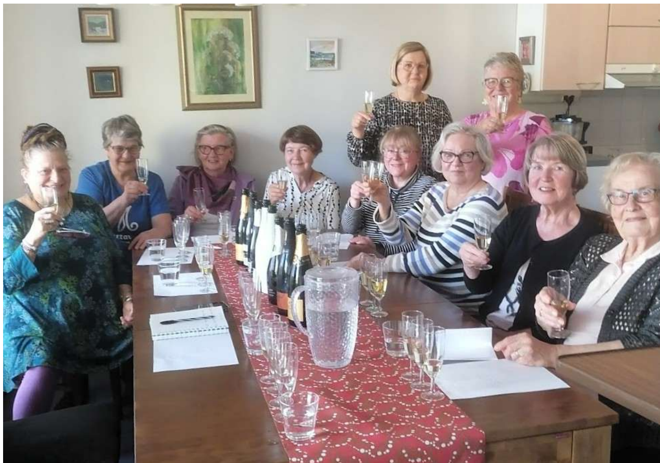
Kuohuviininmaistajaiset 2025.