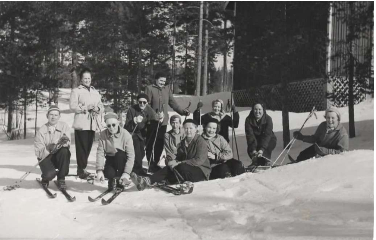
Hiihtoretki Patakahjaan 1959.