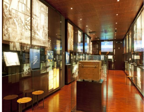
Museon yksi näyttelyhuone

TYKS Senioreitten vierailut otsikon kohteissa karkauspäivänä 2024 oli järjestäjien taholta nappiin osunut valinta. Suomen Pankin Rahamuseossa kuultu luento Suomen markan historiasta euroaikaan asti oli virkistävää kuunneltavaa olit sitten sairaanhoitaja, lääkäri, teknikko tai ekonomi. Niin seteleiden kuin kolikoidenkin ulkonäkö on moneen kertaan muuttunut ja vaihdellut matkan varrella. Puhumattakaan rahan reaaliarvosta. Vuoden 1963 rahauudistus, jossa markan arvoksi määritettiin 1/100 siihen astisesta on varmasti useimmilla senioreilla vielä muistilokeroissaan. Fyysistä rahaa käytetään tänä päivänä entistä vähemmän, kun digitaalisuus on vallannut alaa ja korttimaksua tai verkko-ostoksia tehdään aina vaan enemmän. Mielenkiintoista ja aika yllättävääkin oli kuulla, että Suomen Pankin rahavarastoissa säilytetään edelleen suhteellisesti sama setelimäärä liikkeellä olevaan rahaan peilattuna kuin aiempinakin vuosikymmeninä. Myöskään säilytettävä rahamäärä ei ole nimellisesti pudonnut korttimaksamisen yleistymisen tahdissa.