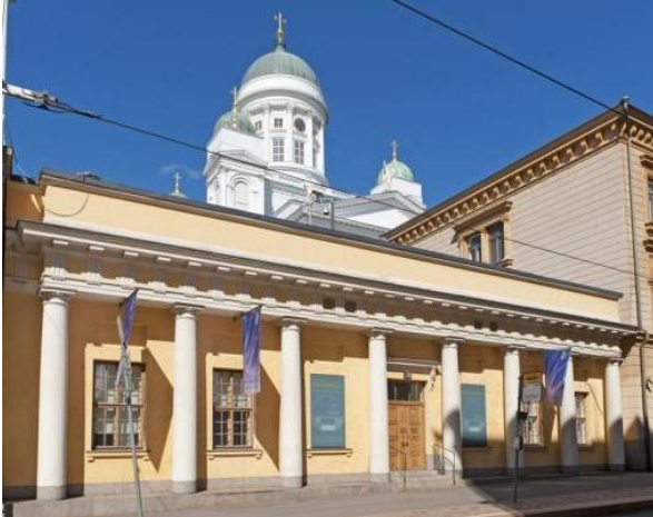
Suomen Pankin Rahamuseon sisäänkäynti