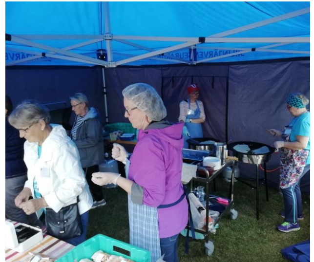
Kirkonmäki kuhisee ELOA 2021

Korona-aika eli covid-pandemia puhkesi keväällä 2020 pysäyttäen maaliskuulla valmiuslain nojalla kaiken kokoavan toiminnan. Myös vappumyyjäiset jäivät järjestämättä, kun kirkon tilat eivät olleet käytettävissä. Syksyllä voitiin marssia jonkin verran.