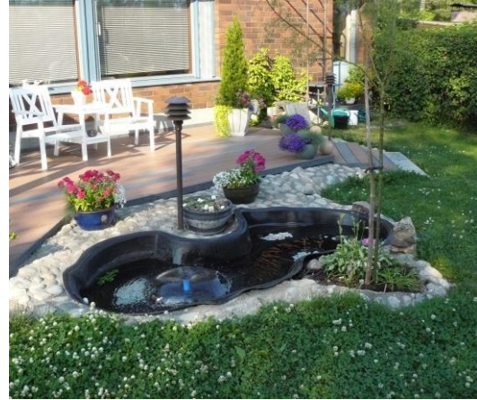
Kuvassa touhua oman yhdistyksen ruukkupuutarhakurssilta Laitasilta 2010. Oikealla lopputulos syksymmällä: hyvin kukkivat!

Virkistytymistä on harrastettu mm. käymällä Kuopion teatterissa sekä kesäteattereissa, konserteissa musiikkikeskuksella sekä varsinkin joulun alla yhteisesti ruokailemalla. Yhteisesti Kaavin Marttojen kanssa harrastettiin melontaa Vaikkojoella sekä naurujoogaa Vuorelan koululla.