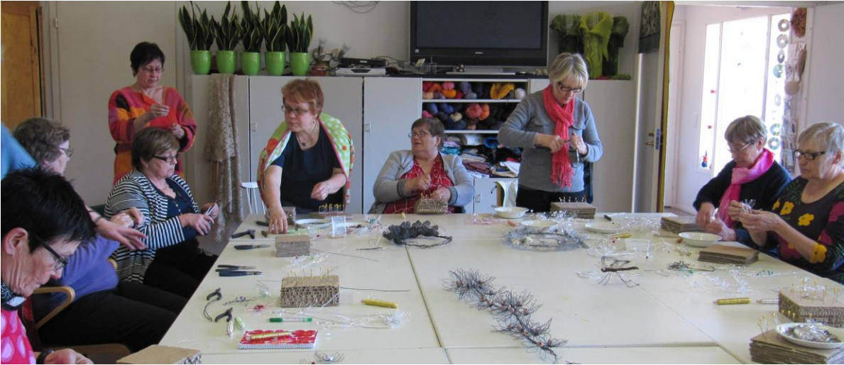
Taitolomalla metallilankakukkia tekemässä ja juhlimassa 14.5.2011