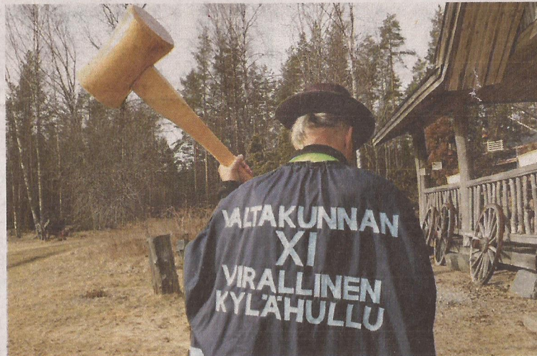
Yhdestoista virallinen kylähullu valittiin 2011. Viitta päällä kulkeva mies ison nuijan kanssa saattaa säikäyttää.

-Kun bussi pysähtyy, kaikki tulevat ulos katsomaan, kuka tuo on. Kysyn sitten, olisiko yhdelle kylähullulle autossa tilaa, Nummela nauraa.