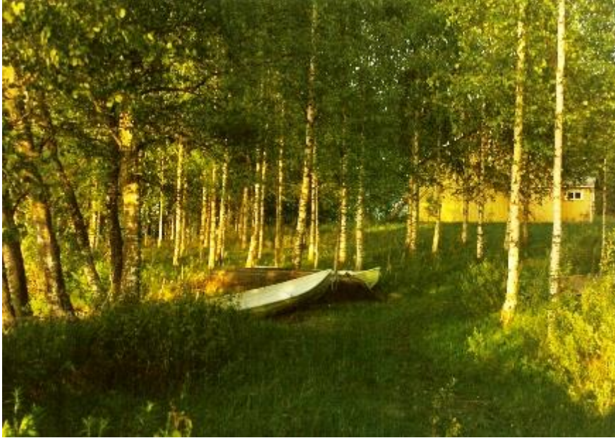
Kariniemi saunapolulta päin

On Kariniemen kohtalo ollut Sellulaisten kannalta joskus vaakalaudallakin, pahiten silloin, kun se liitettiin Metsähallinnon myytävänä olevien kämppien luetteloon. Silloin jännitti melko kovasti, koska tiedettiin, että Savon Sellu ei tule tekemään Kariniemestä ostotarjousta.