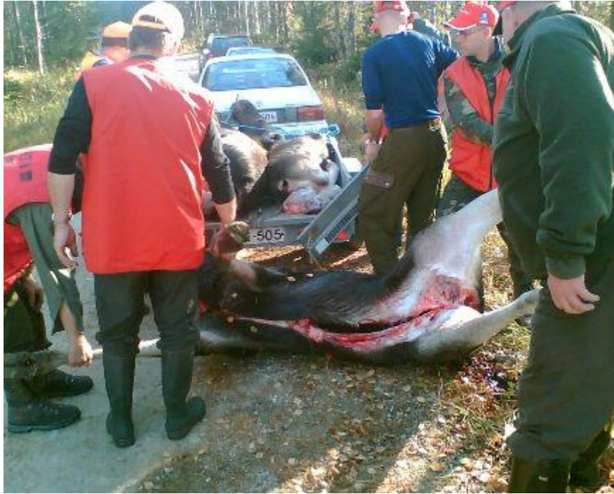
Ensimmäiseksi ammuttu hirvi. Kaataja oikealla.