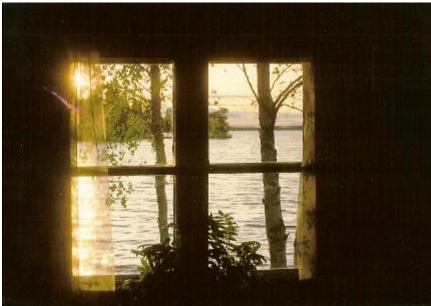
Laakajärveä saunan ikkunasta nähtynä

Laakajärvi on hyvin kalaisa ja toivoisikin, että siellä kävisi enemmänkin esim. perheitä hyödyntämässä kämpän tarjoamia mahdollisuuksia, sekä järven runsasta siika- ja taimenkantaa.