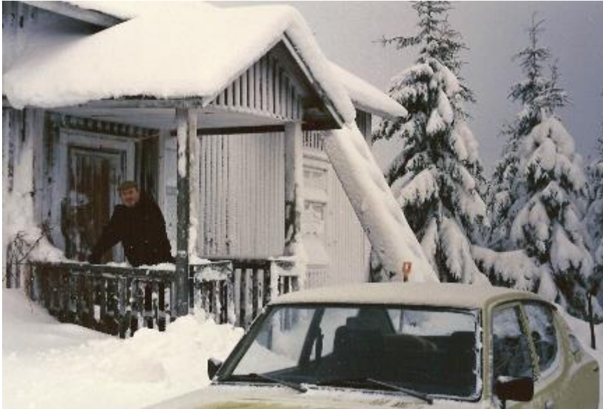
Uskollinen DATSUN 100 A on tuonut perille

Tämän kämpän vuokrasopimus oli allekirjoitettu ajalle 01.08.1986 - 31.12.1989. Metsähallinto esitti kuitenkin tammikuussa 1989, että yhtiö luopuisi Särkimäen kämpästä kesken vuokrakauden. Yhtiö vastasi suostuvansa pyyntöön. Metsähallinto luovuttaisi kämpän Rautavaaran kunnalle, suunnitteilla olevan metsätyömiesmuseon sijoituspaikaksi. Tätä museota ei sinne kuitenkaan koskaan tullut, ilmeisesti kunnalta ei löytynyt tarvittavia rahavaroja sen ylläpitämiseen.