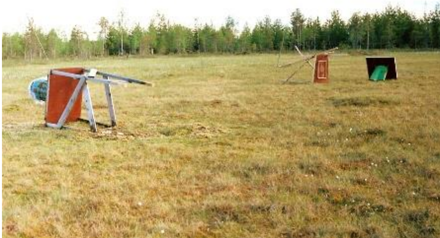
Kovin puutteelliset olivat karhun ruokailutavat!

Tällaisen "hyvän työn" teki Itkon karhu, lopettaessaan teerien automaattiruokinnan ainakin toistaiseksi seuramme historiassa. Toivottavasti sai ainakin julman ripulin!