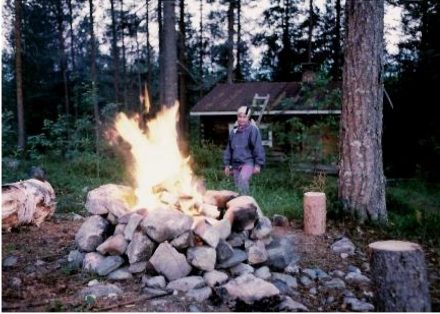
Parsin sauna tulipaikalta nähtynä