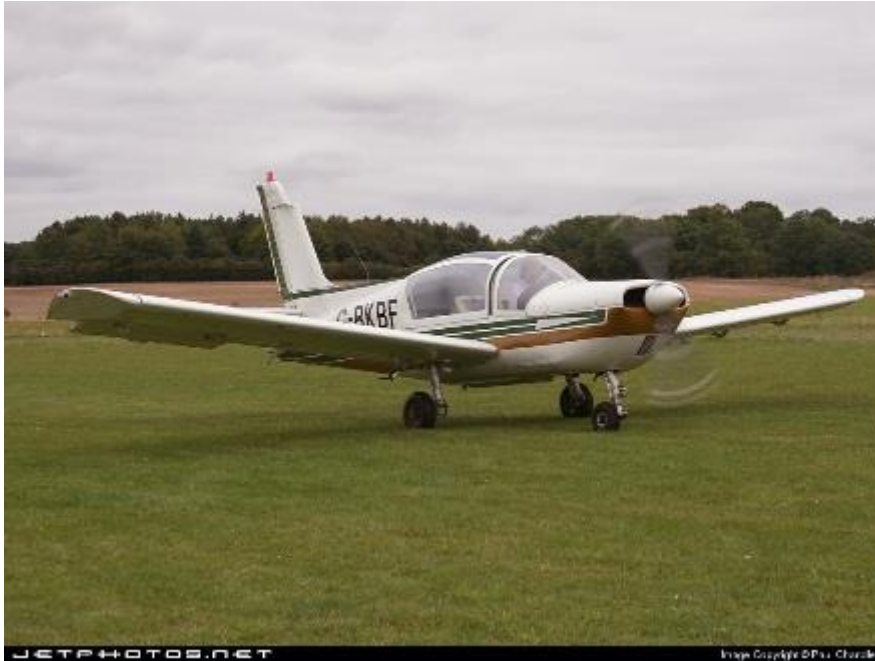
Valitettavasti tapahtumasta ei ole jäänyt valokuvia. Kuvassa samanlainen kone, ei kuitenkaan sama yksilö.