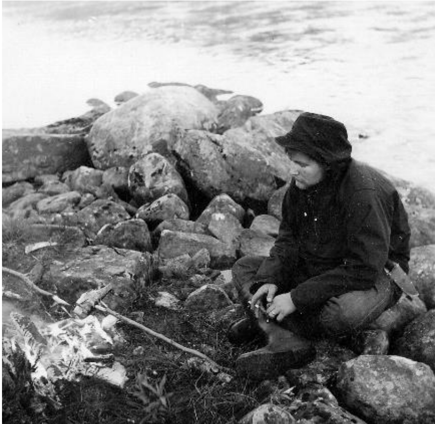
Kala kypsyy Näätämonjoella 1960

Kun näin hänen vajaan tunnin kuluttua melovan sillä samalla haapiolla, jota poikien kanssa seitsemän vuotta aikaisemmin olimme lainanneet, varmistui kuka oli kämpän ja kanootin tehnyt.