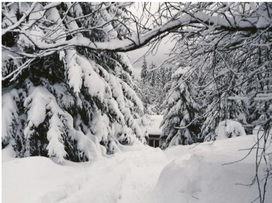
Särkimäen sauna keskitalven kaamoksessa

Metsähallinto tarjosi Savon Sellulle vuokrattavaksi 01.08.1986 alkaen entistä metsänvartijan taloa, joka sijaitsi Hiirenjärven maastossa sijaitsevasta pyöräkämpästä vajaan kolmen kilometrin päässä, nimensä mukaisesti Särkimäessä. Tässä talossa oli suuri tupa ja kaksi pientä makuukamaria. Tuvassa oli kookas leivinuuni ja kamareissa uunit, jotka tuppasivat helposti savuttamaan. Pihasta laskeutuvan polun päässä oli saunarakennus.