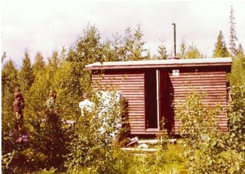
Tiilikan kämppä. Jos joku tunnistaa itsensä, kertokoon.

Tiilikan metsästyksalueelle, joen rantaan, vietiin yöpymiskäyttöön kunnostettu vanha työmaakoppi. Muuten vieni onnistui oikein hyvin, mutta koppi tuli laitettua vikarannalle. Kun seuraavan kerran mentiin paikalle, oli kopin seinään isketty julmat teesit kopin siirtämiseksi muualle. Joen se puoli sattui olemaan Saastamoinen Oy:n omistuksessa. Onneksi siinä kohdassa jokea oli silta ja saatiin koppi haalattua omalle vuokra-alueelle.