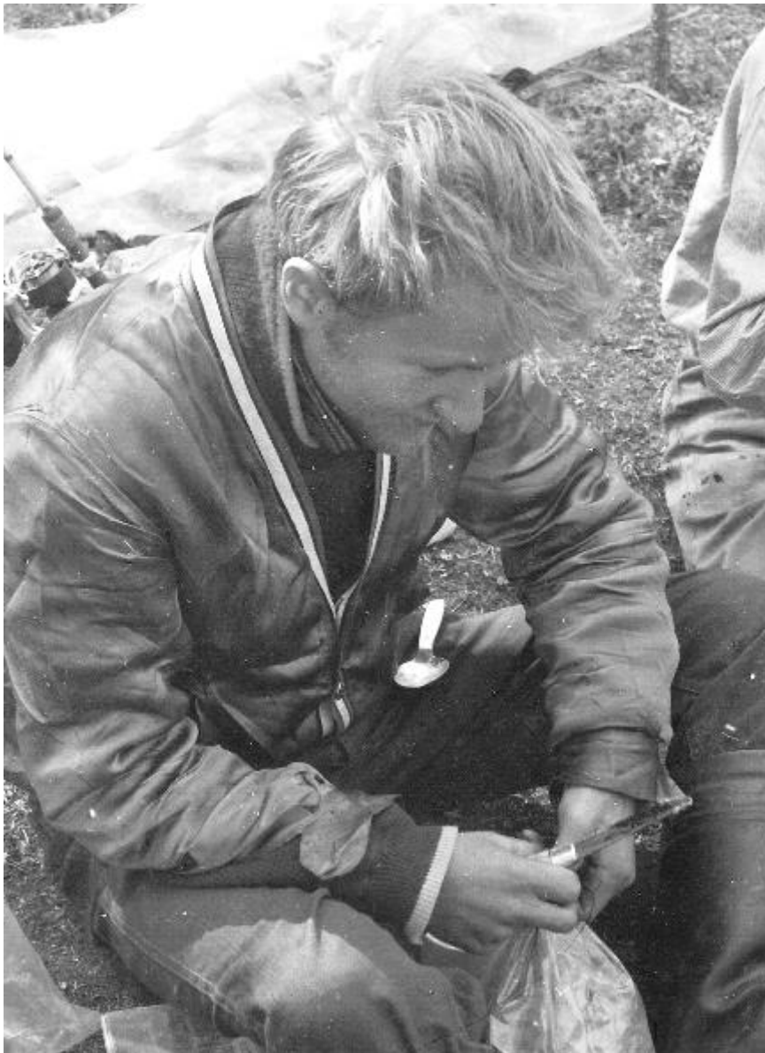
Ensimmäiseltä Lapinreissulta 1956

Lappi on kiehtonut minuakin jo 50-luvun alkuvuosista lähtien. Sain vanhemmiltani joululahjaksi Yrjö Kokon kirjan "Laulujoutsen". Seuraavana vuonna sain kirjan "Sudenhampainen kaulanauha" ja vuonna 1954 toisen joutsenkirjan "Ne tulevat takaisin". Nämä kolme kirjaa, jotka ovat vieläkin minulla, tuli luettua moneen kertaan ja polte rinnassa kävi niin voimakkaaksi, että 16 vuoden ikäisenä v.1956 päätettiin parin kaverini kanssa lähteä ensimmäiselle Lapin reissulle Saariselän erämaahan.