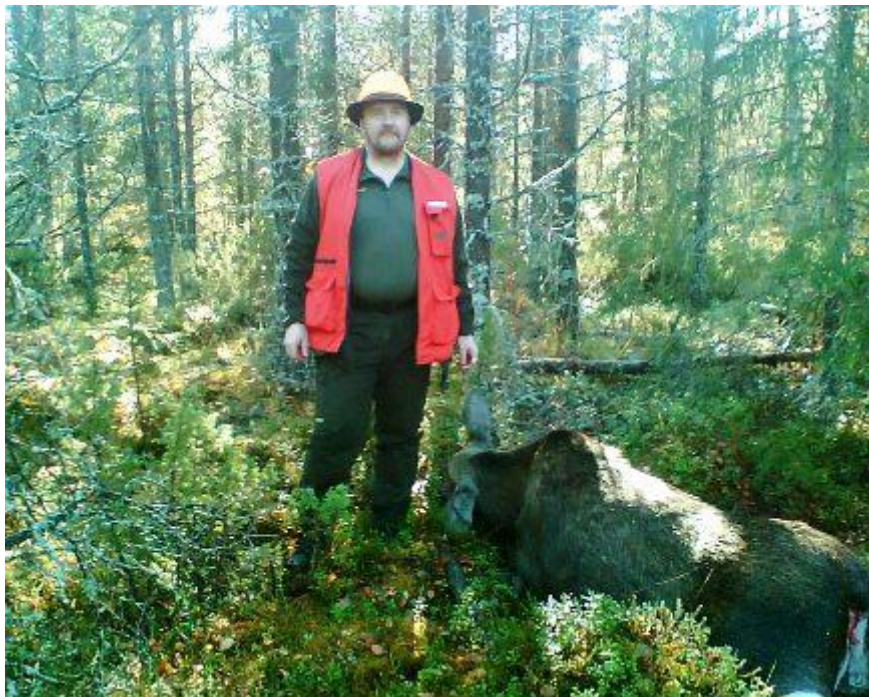
Löytyihän se ammuttu hirvi vihdoinkin ja viimein!