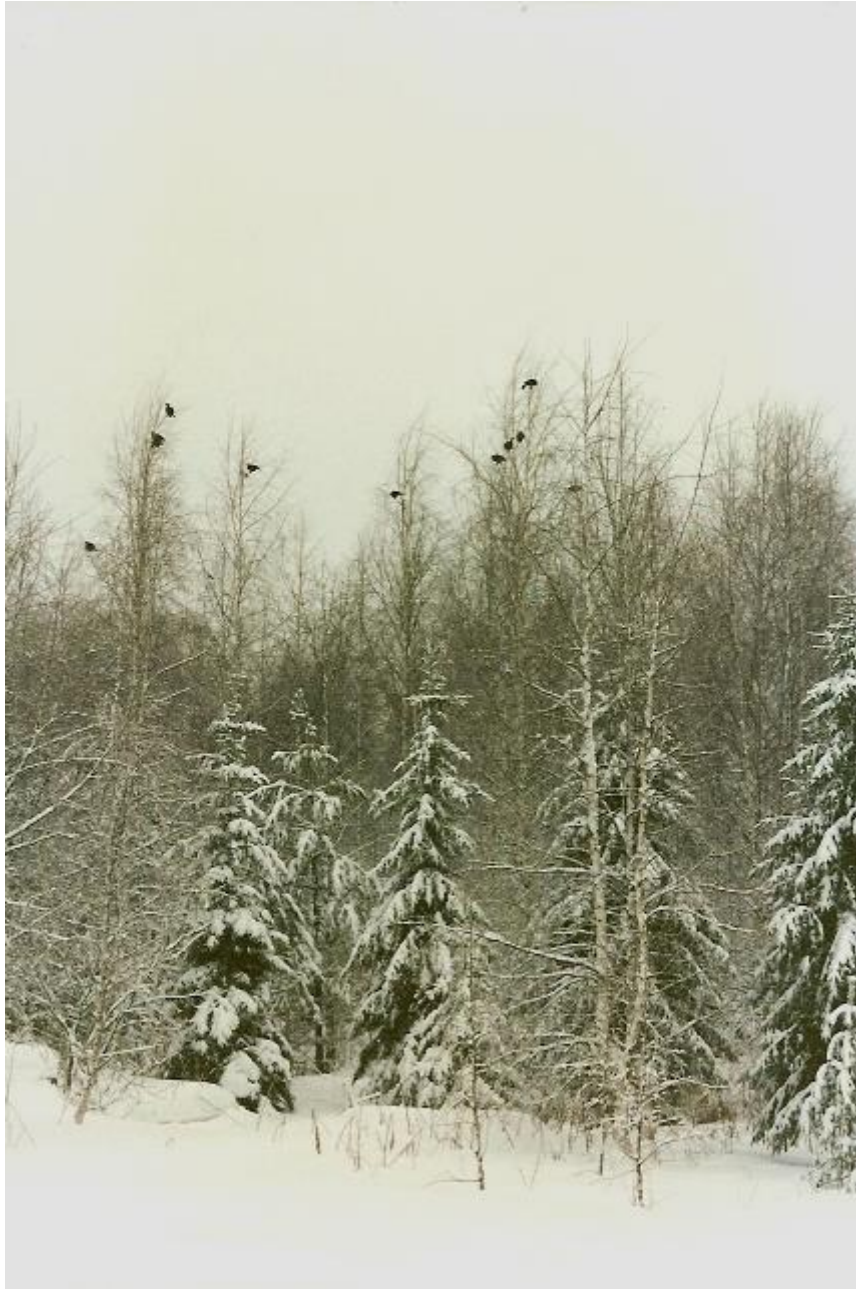
Teeriparvi ruokailemassa Kariniemen pihakoivikossa, kovassa pakkasessa, eräänä jouluna.

Sovittiin, että yhtiö ottaa virallisesti yhteyttä Metsähallintoon, jolloin he sitten esittävät vuokrapyyntönsä ja sopivat muista vuokraukseen liittyvistä ehdoista ja asioista. Kerroin nämä tietoni yhtiölle ja asiat lähtivätkin rullaamaan vauhdilla positiiviseen suuntaan. Olin melko iloinen poika, kun minulle kerrottiin yhtiöstä, että vuokrasopimus on allekirjoitettu ja se astuu voimaan 01.06.1993. Ensimmäinen vuokrasopimus oli allekirjoitushetkestä johtuen hieman lyhyempi, mutta sen jälkeen se on solmittu aina viideksi vuodeksi kerrallaan.