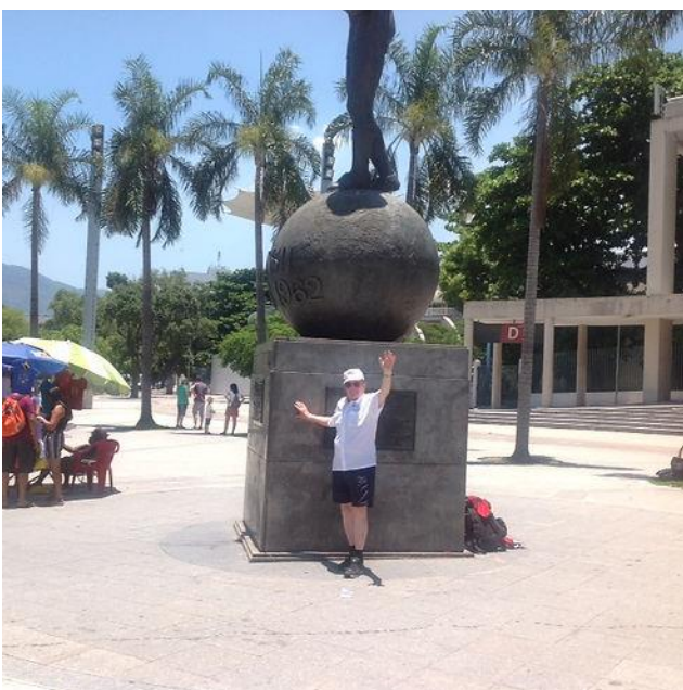
Uolevi Maracana-stadionin edustalla

Toivon edellisten arviointieni kannustavan maailmankuvansa laventamiseen pyrkiviä senioreita ja kaikkia muitakin vireitä kanssakulkijoita. Siispä mielikuvitusta ja rohkeutta matkavalintoihinne!