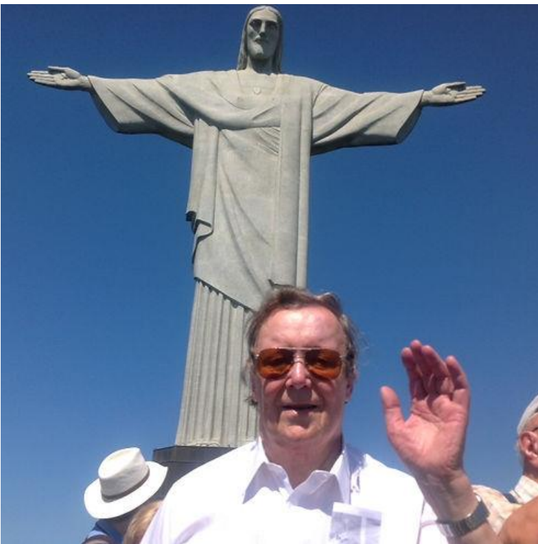
Kristuksen kädet ja Uolevin käsi