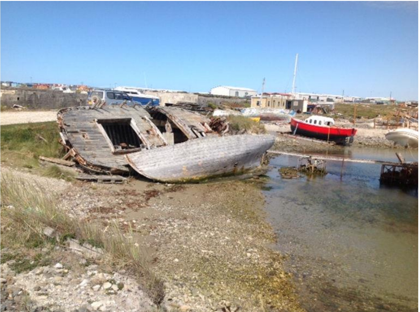
Port Stanleyyn "muistomerkkejä".