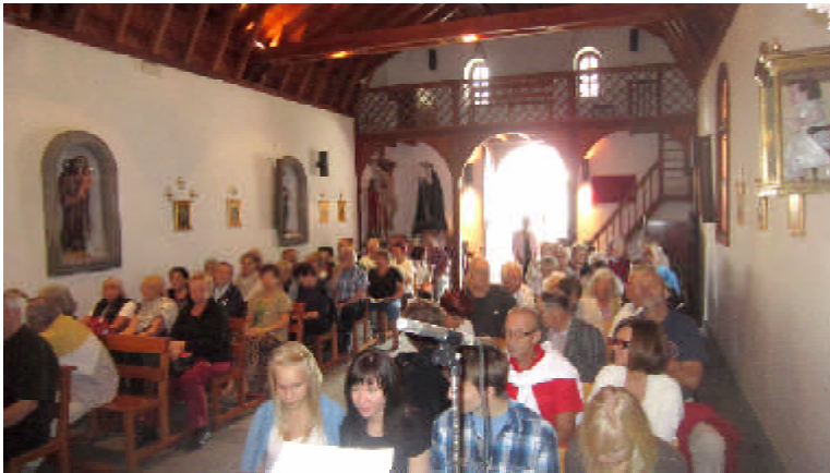
Seurakunta järjesti useita Kauneimmat joululaulut-tilaisuuksia. Tässä kuva Agaetesta.