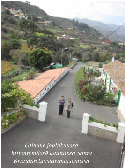
Olimme joulukuussa hiljentymässä kauniissa Santa Brigidan luostarimaisemissa

Maaliskuun lopulla järjestämme 1-2 vrk mittaisen reititin Santa Brigidassa.