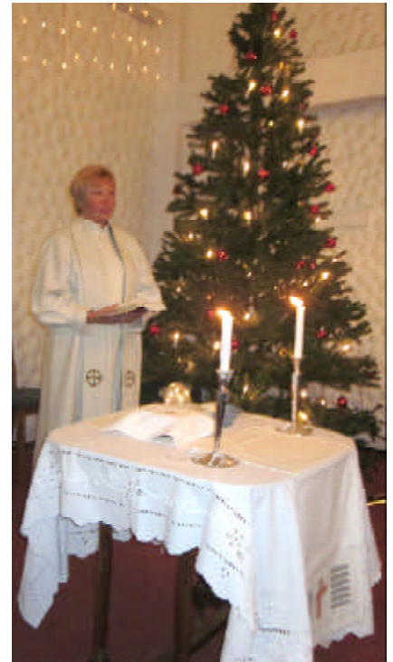
"Tulkoon Juhla todellinen, tulkoon Jeesus Herraksi sen."

Skandinaavisessa turistikirkossa keskustelupiiri "Puhetta Pyhästä" lauantaisin 14.1., 21.1., 28.1. ja 11.2. klo 14.