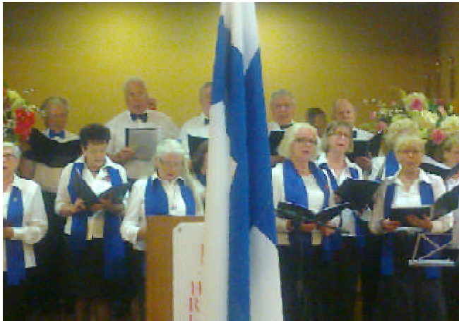
Suomi-Kerho esitti kauniita ja koskettavia lauluja juhlassa.