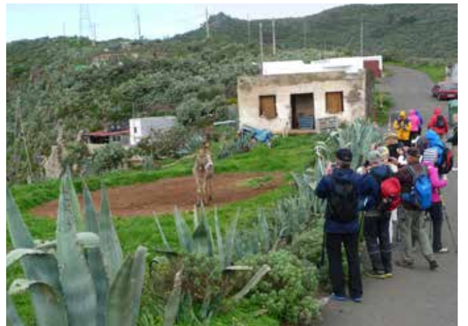
Tavattiin monille "kouluajoilta tuttu".