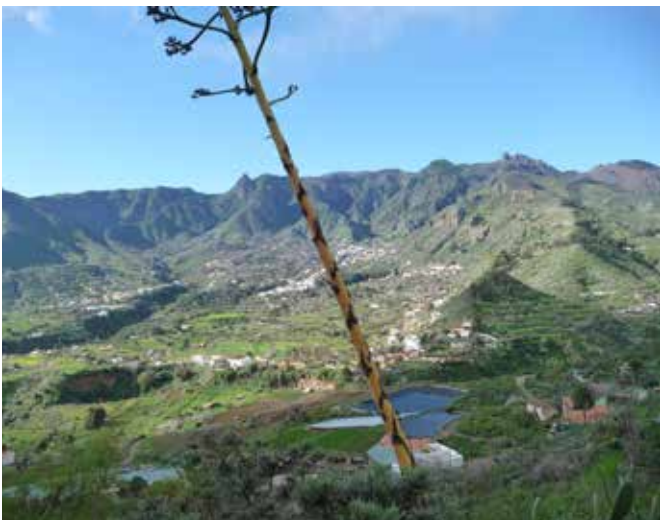
Vuoren eteläpuolella paistoi aurinko.