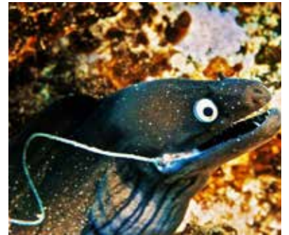
Musta mureena kurkistelee kotikolostaan.

Sukellusretkiä tarjoavia yrityksiä on paljon ja kilpailu asiakkaita pitää hinnat edullisina. Yksi sukellus maksaa 25-30€, 10 kerran kortti 180-250€ ja hintoihin sisältyvät kuljetus, laitteet/varusteet ja lounas sukellusten välissä. Päivän aikana tehdään yleensä pareittain kaksi sukellusta, koskaan ei sukella yksin. Rantasukellukset ovat halvempia kuin laivasta tehtävät, samoin päiväsuikellukset verrattuna yösuikelluksiin. Hintavaihtelua on hieman; Las Palmasissa on edullisempaa kuin saaren eteläosien turisticalueilla. Tarjolla on myös edullisia kursseja aloittelijoille; koulutus tapahtuu luonnollisissa olosuhteissa meressä, joka on mielestäni etu verrattuna allasopetukseen, jota Suomessakin joudutaan tekemään kylmien ja sameiden luonnonvesien johdosta. Laitesukeltamisessa on voimassa kansainväliset turvallisuusmääräykset, joita myös Kanarialla noudatetaan tarkasti. Sääntöjen noudattaminen, oma huolellinen toiminta, sukellusalueen tuntemus ja luonnonolosuhteiden huomioiminen tekevätkin lajista turvallisen.