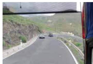
Näköala oppaan silmin.

Lopuksi suunnistimme Ciudad Altan ja Tamaraceiten kautta Las Palmasin korkeimmalle pueblolle (kylälle), Los Gilesiin. Siellä otimme kuvia alhaalla näkyvästä Canterasin rannasta ja kaupungista. Los Giles on tunnettu ulkoilu- ja urheilupaikka. Siellä on pyöräilijöitä, juoksijoita, vaeltajia ja liitovarjoilijoita. Liitovarjoharrastusta varten vuoren päälle on rakennettu pieni kiitorata nousuja ja laskuja varten. Joka viikko lauantaisin joukko suomalaisia vaeltaa sauvoineen Canterasin rannasta Gilesin kylään ja takaisin. Tiistaisin ja torstaisin samainen joukko taittaa matkan toiseen suuntaan Las Coloradoskylään. Lähtöaika on klo 9 Ankkuri-ravintolan edestä. Mukaan voi liittyä kuka tahansa, joka kokee jaksavansa kävellä tuon n. 8,5 km:n matkan.