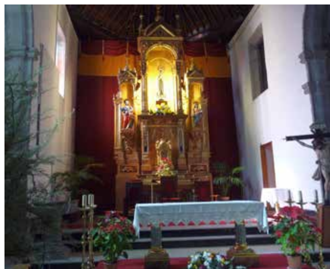
Kuva San Mateon kirkosta.