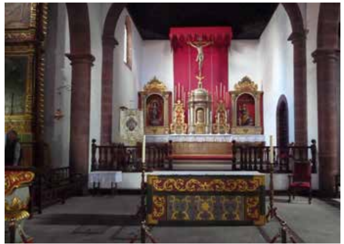
San Sebastianissa sijaitsevan kirkon Inglésia Nuestra, señora de La Asuncion alttari.