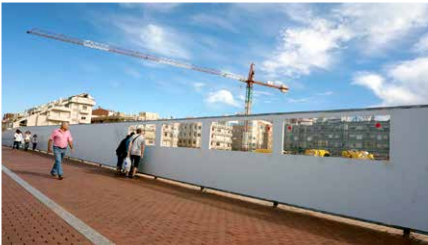
Urheilukeskuksen työmaa näyteikkunassa.

Rakentamisen edistymistä pääsee seuraamaan Cicerissä Las Canterasin varrella, sillä valkoiseen aitaseinään on jätetty sitä varten muutama ikkuna-aukko.