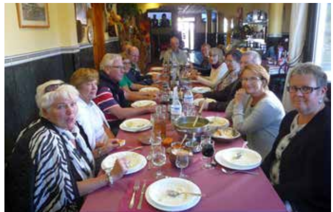
Ruokatauko Bar Coia, Chipuden kylä.