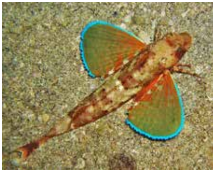
Kanarialainen lentokala osaa kävellä, uida ja lentää.

tehdään merivirtojen mukaan, pienellä saarella suuren valtameren ympäröimänä tämä on välttämätön turvallisuustoimenpide, johon tulee suhtautua vakavasti! Näkyvyys vedessä on usein hyvä, 30-40 m. Kanarian vedet ovat 17-23 C° asteisia vuodenajasta riippuen, syvemmällä on kylmempää ja sukelluspuvun käyttö on ympärivuotista. Sukelluslisenssi (esim. PADI tai CMAS) ja -vakuutus ovat