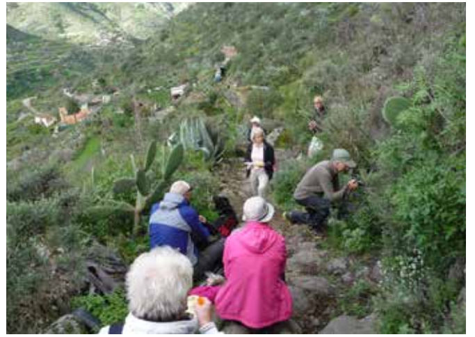
Kivinen oli polku mitä ylöspäin yritettiin.