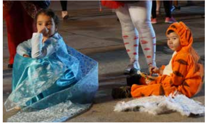
Kuva on kahdesta jo hieman väsyneestä pienestä karnevaalijuhlijasta kun vanhemmat jaksavat vieressä vielä sambata.

Perinteiseen tapaan tänäkin vuonna jouduttiin käyttämään lakimiehiä ja hakemaan lakituvasta päätöksiä ennen kuin päästiin viettämään varsinaista karnevaalia. Las Palmasin karnevaaliohjelmistoon kuuluu useampana yönä vietettävä ”Mogollones” eli ”Yökarnevaali”. Se on tapahtuma joka alkaa varsinaisen konsertin tms. jälkeen ja kestää aamuviiteen tai kuuteen. Sitä varten on pystytetty pikkukioskeja joiden tarjonta sisältää normaalia yösyömistä, kuten hampurilaisia, kuumia koiria yms. mutta myös monipuolisesti alkoholipitoisia juomia. Ohjelmassa on monenlaista musiikkia ja vapaamuotoista seurustelua, eli meteliä riittää. Lähinnä tapahtuma muistuttaa Taiteiden yötä Helsingin Esplanadilla. Näitä yö-tapahtumia oli merkitty tämänvuotiseen ohjelmaan seitsemisen kappaletta. Niiden pitopaikaksi oli suunniteltu Elder-museon ja linja-autoaseman välistä aluetta kuten edellisinäkin vuonna. Lähitalon asukkaat valittivat perinteiseen tapaan tuomioistuimeen yöleponsa häirinnästä, ja saivatkin päätöksen joka kieltää yökarnevaalit tuossa paikassa. Niin ikään perinteiseen tapaan käytiin hermoja raastava neuvottelu- ja kiristyskierros kaupungin ja asukkaiden välillä kunnes saatiin molempia osapuolia tyydyttävä ratkaisu. Kaupunki maksaa ko. talon asukkaille korvauksia aiheutetusta haitasta ja yökarnevaalit saatiin pitää. Miten käynee ensi vuonna, sillä seuraavankin talon asukkaat ovat ilmaisseet haluavansa hekin korvauksia ainakin ensi vuodesta lähtien.