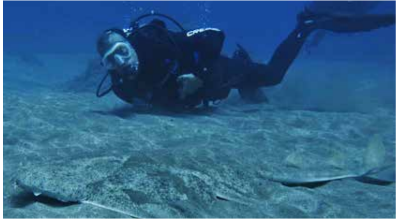
Kahden metrin pituinen enkelihai piiloutuu taitavasti pohjahiekkiaan.

pakollisia; tavallinen matka- tai tapaturmavakuutus ei kata sukellusvahinkoja. Lokikirja on hyvä pitää mukana ja vesitiiviistä kamerasta on paljon iloa.