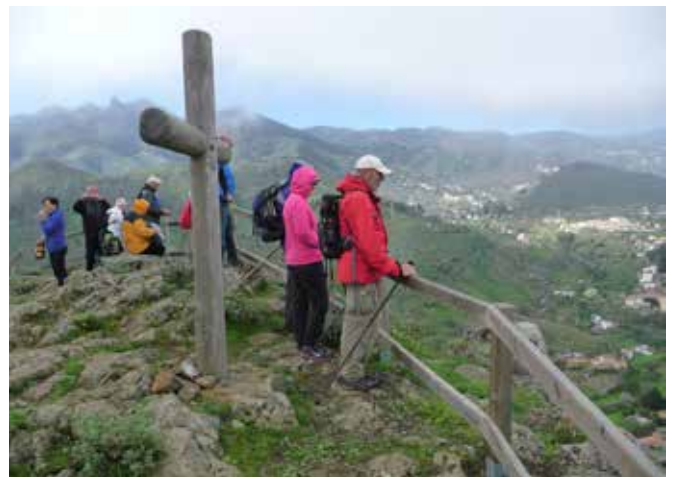
Määränpää häämötti siellä jossain alhaalla.