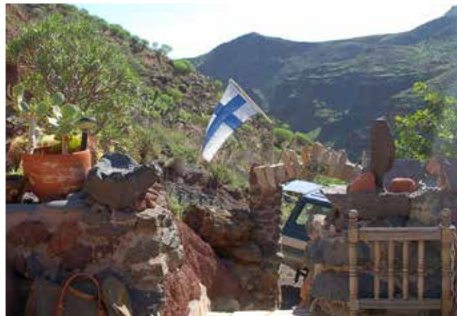
Suomen lippu on vastaanottajana luolahuvilan portaikossa upea maisema taustanaan.

Pieni ortodoksien ikoni odottaa kiviseinällä luolahuoneeseen tulevaa ”pyhiinvaeltajaa”, kumarrus ja ristimerkki ovat paikallaan. Luojalla on ollut ilmeisesti oma tarkoituksensa luolia tehdessään. Lämpöä – sitä ei luoli-