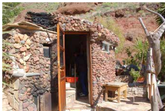
Suomalainen saunan ovi on viettelevästi auki – kivilau-teilla voi nauttia kuumista löylyistä.