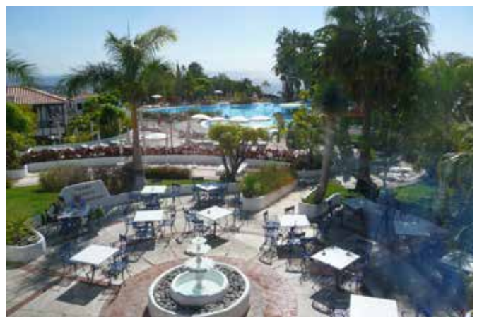
Osa hotelli Jardin Tecinan pihapiiristä.