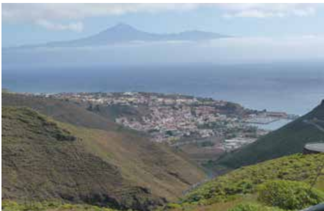
Alhaalla San Sebastian de la Gomera. Taustalla hämmöittää Teide.