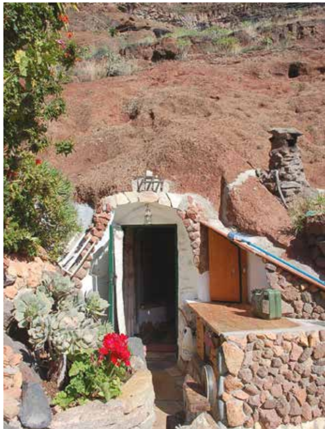
Huvilakokonaisuudessa on kolme luolaa – sisäänkäynti olohuoneeseen on kauniisti koristeltu.

Kiveen hakattuna, luolaan sijoitettuna mieli lepää hiljaisuudessa. Käsi hyväilee porttikiveä, jättää pitkän elämänviivan pölyyn, mutta ei poistu. Työn jäljet kolmesta-toista talvesta ovat avoinna, vanhat avaimet ovat seinällä. Kolmentoista kesän poluille kiveämät ajatukset ovat kanjonin seinämään piirretty kuin tauluun ikuistettuina. Luola-Anjan sormet ovat tunteneet guanchi-naisten luolaryijyjen sanoman – sen voi aistia nyt luolien lämmössä.