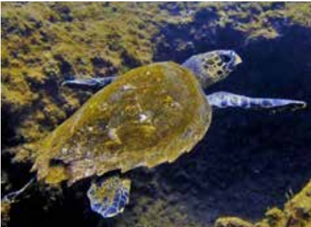
Nälkäinen kilpikonna etsimässä ruokaa.

Olen harrastanut laitesukellusta yli 30 vuotta ympäri maailman meriä. Sukelluspiireissä ei Gran Canariaa pidetä mitenkään erikoisena tai suosittuna sukelluskohteena - tämä käsitys alkoi kuitenkin ensikokemusten myötä pian muuttumaan. Ehkä sukellustarjonta hukkuu eri aktiviteettien tarjontaan, joita täällä on paljon tarjolla. Olen käynyt neljässä suosituimmassa kohteessa (Sardina Del Norte, Tufia, El Cabron ja Risco Verde) ja niistä löytyvät kokeneemmankin sukeltajan toiveet; vedenalaista elämää, riuottoja, luolia, hylkyjä, kasvillisuutta ja kirkasta vettä.