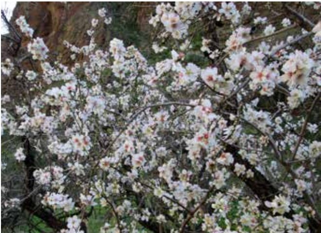
Mantelpiuta oli matkan varrella.

Korkeimmalla kohdalla oltiin vähän yli kilometrin korkeudessa pilvien tasossa. Lähtöpaikalla Valsequillossa vuoren etelärinteellä paistoi aurinko. Pohjoispuhurin sadepilvet pysähtyivät vuoren pohjoispuolelle. Vanhan sanonnan mukaan huipulla aina tuulee, niin nytkin kävi. Kun pääsimme huipulle ja sen pohjoispuolelle, mieleen tuli pilkkireissut Suomessa. Tihkusade jäi onneksi vähäiseksi. Laskeuduttaessa Vega de San Mateon kaupunkiin aurinkokin muisti patikoitsijat. San Mateossa oli maratonkilpailut ja markkinat. Maratoniin emme osallistuneet. Meille riitti vuoren ylittäminen.