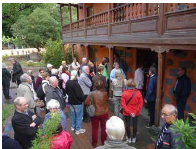
Vierailu Museo de vino, Santa Brigida.