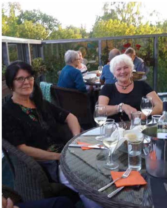
Tulopäivän illanvietto puistoravintolassa.

Teksti Marja Puuska