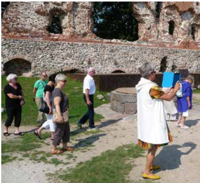
Viljandin linnan raunioita.

Suomi-Kerhon kesätapaaminen toteutettiin matkalla naapurimaahamme Viroon Viljandin kaupunkiin. Ajankohta oli perinteisesti elokuun alkupuolella, tarkemmin sanottuna 7.-9.8. Viljandi kuulostaa varmaankin vieraalta perinteisille Eestissä kävijöille. Matkaa suomalaisten tavanomaisesta matkakohteesta Tallinnasta Viljandiin on noin 160 kilometriä. Matkakohteemme vanha Hansa-kaupunki sijaitsee Mulgamaalla Etelä-Virossa Viljandi-järven rannalla. Vuosisatojen ajan kauppatavara kulki Viljandi-järven kautta Itämereltä Emajoelle, Tarttoon, Peipsi-järvelle ja edelleen Novgorodiin. 1200-luvun alkupuolella saksalaiset ristiretkeläiset valloittivat alueen. Tälle keskeiselle kauppareittejä halkoneelle paikalle nousi saksalaisen ritarikunnan kivilinna,