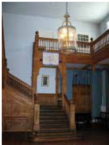
Sisäkuva kartanon aulasta.

tävempiä tulolähteitä. Olustveren viinatehdasrakennus on edelleen olemassa, mutta ei viinanvalmistuskäytössä. Rakennuksessa on nyt mm. keramiikka- ja lasityöpajoja.