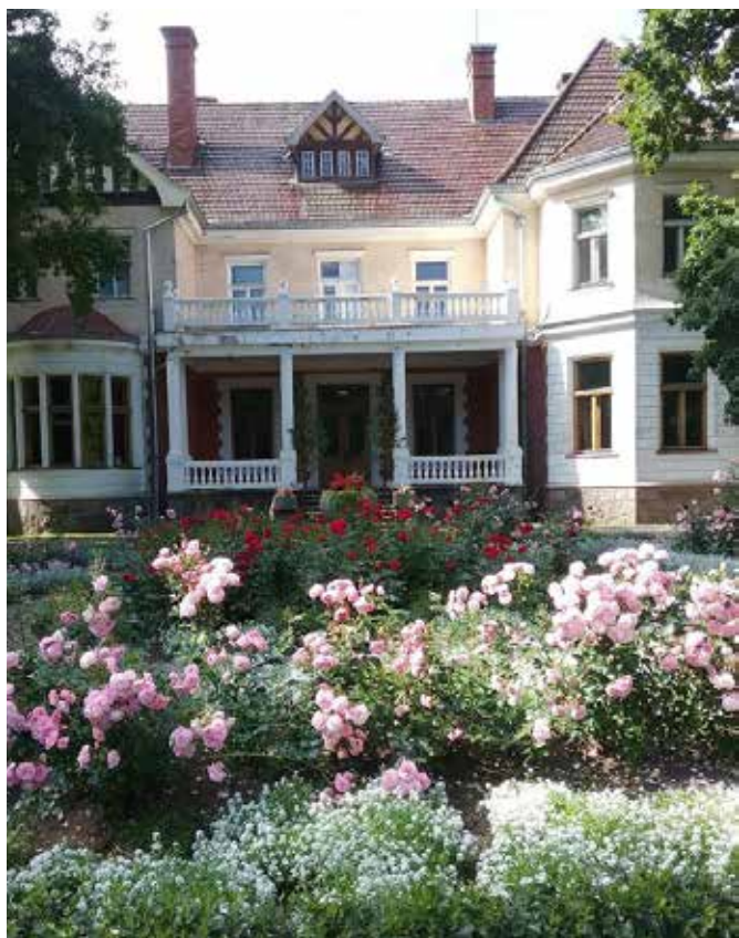
Kartanon julkisivu kauniine kukkaistutuksineen.