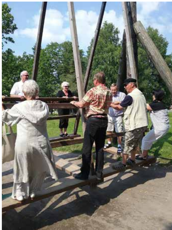
Keinussa kesällä kerran...