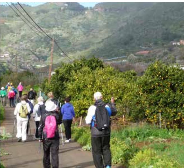
Näin hienoissa maisemissa retkeilevät Suomi-Kerhon jäsenet. Kuva viime keväältä San Mateon retkeltä.