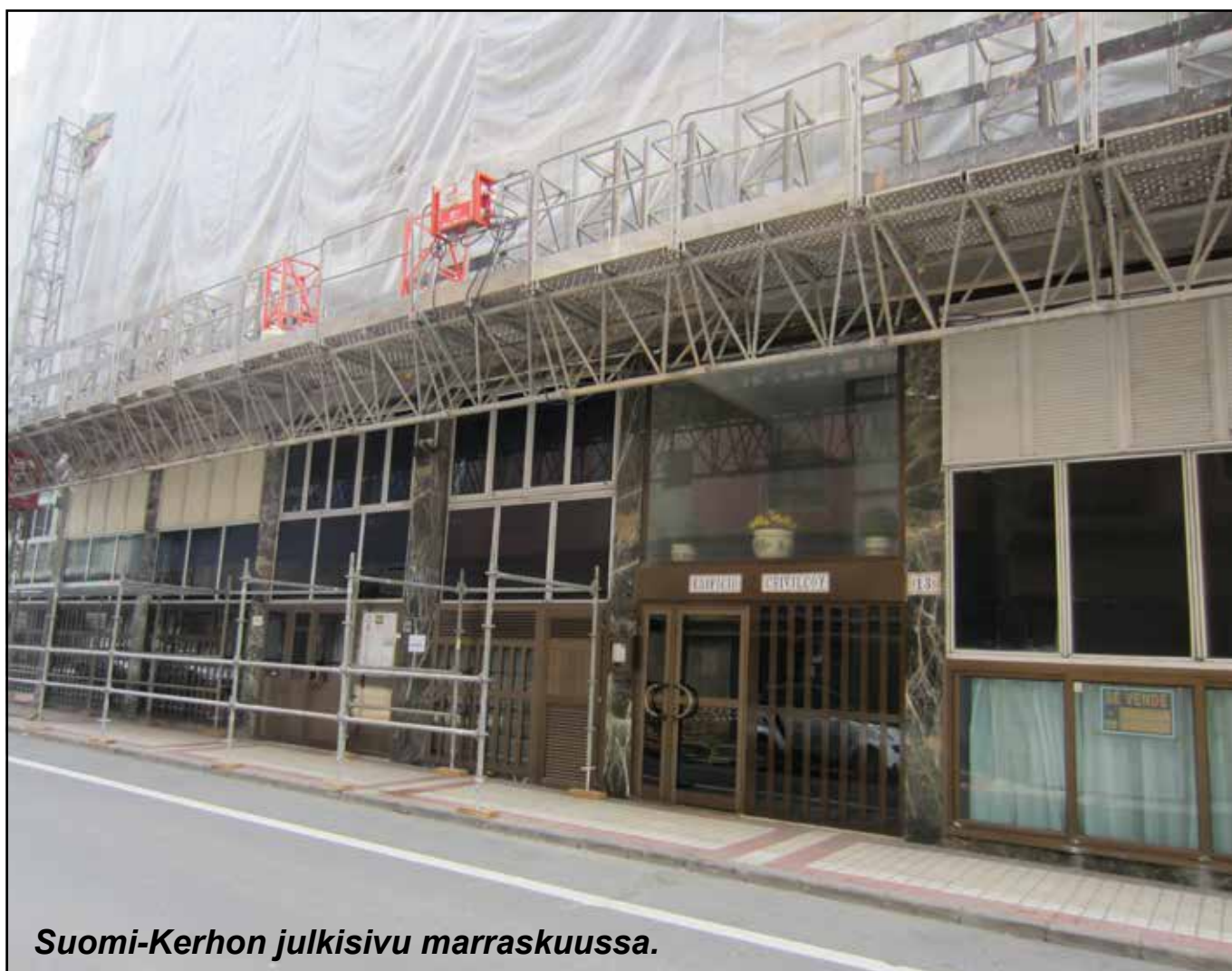
Suomi-Kerhon julkisivu marraskuussa.