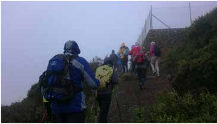
Gran Canarian Wuorigorillat lähdössä Artenaran vaellukselle lähtöpaikalta Gruz Tejedalta tammi-kuussa 2015.