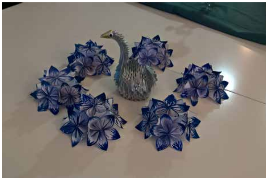
Näin upeita pöytäkoristeita valmistui itsenäisyyspäiväksi askartelijoidemme käsissä.