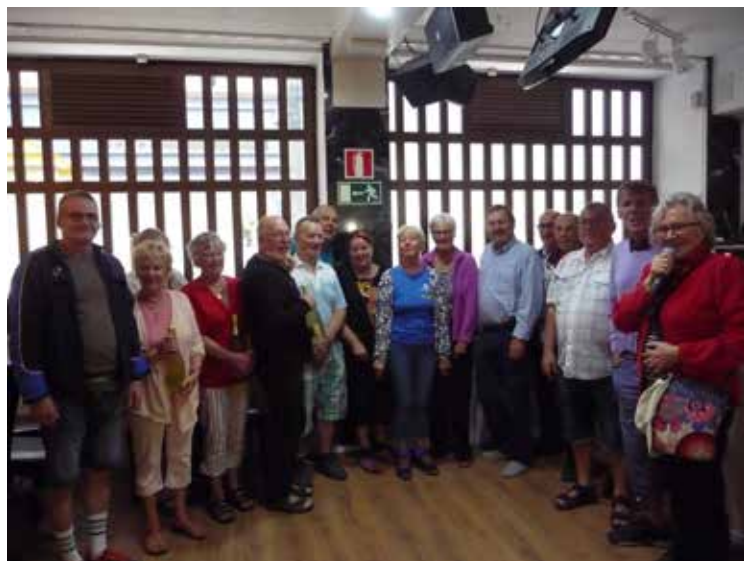
Kerholla otetussa kuvassa on myös varamiehiä, toimitsijoita ja vieraiden puolelta muutama katsoja. Suomi kerho tarjosi kahvit ja täytetyt sämpylät koko porukalle.

Ottelu pelattiin 21.1.2017 ja se oli mukava ja lämminhenkinen. Kannattaa varmaan uusia seuraavallakin kaudella.