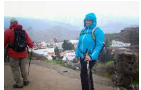
Artenaran kaupunki sumun keskellä