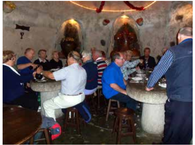
Ruokailimme Tagoror-ravintolassa, lähellä luola-asumuksia.