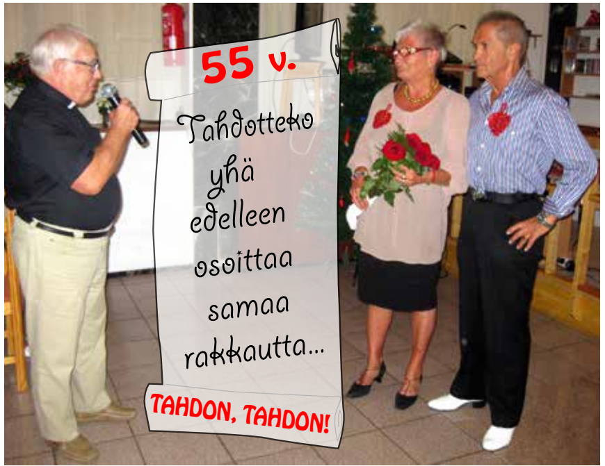
Vihkivalan uusiminen pikkujoulussa.