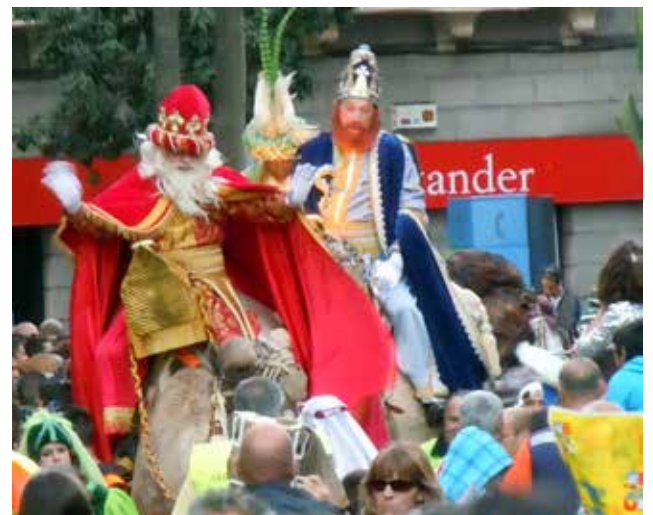
Kolmen kuninkaan kulkue!