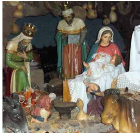
Löytyi sieltä kirkkokin. Valtava joulubelén samassa rakennuksessa, on näkemisen arvoinen paikka, josta yksityiskohta kuvassa.