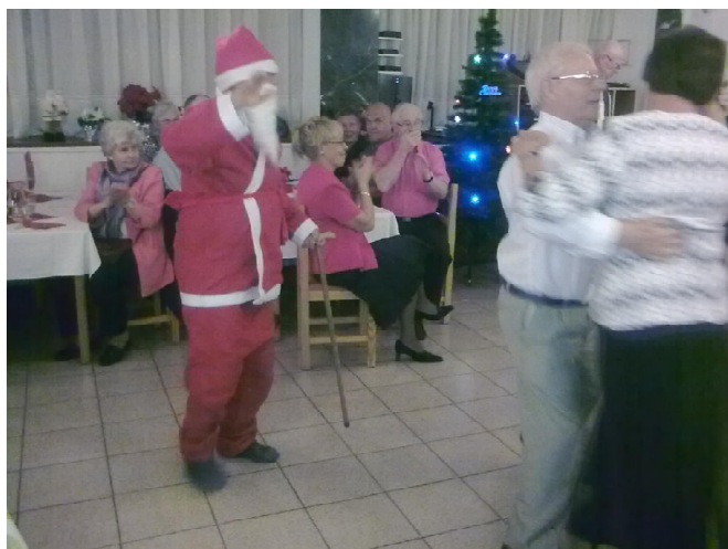
Hauskaa oli tanssin pyörteissä, pukkiakin ihan nauratti.