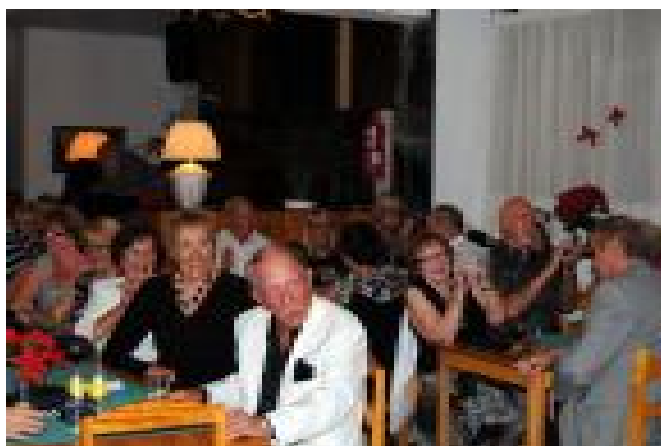
Vuoden vaihtumista odotellaan.