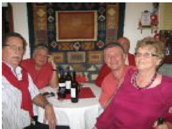
Joulupäivällisen alkamista odotellessa.