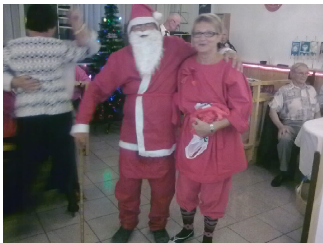
Joulupukki ja tonttumuori lahjojen jakopuuhiassa.