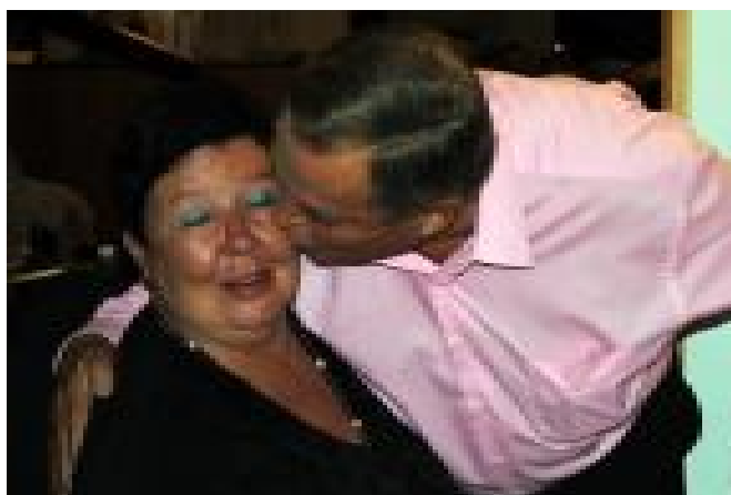
Suukko uudelle vuodelle.