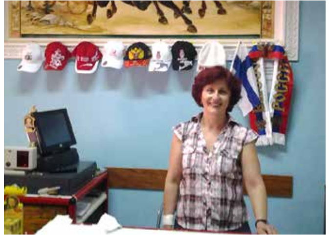
Svetlana myyntitiskin takana.

Troikassa on muutamia asiakaspaikkoja. Myyjä tekee pyydettyä vaikkapa erilaisia voileipiä. On saatavana