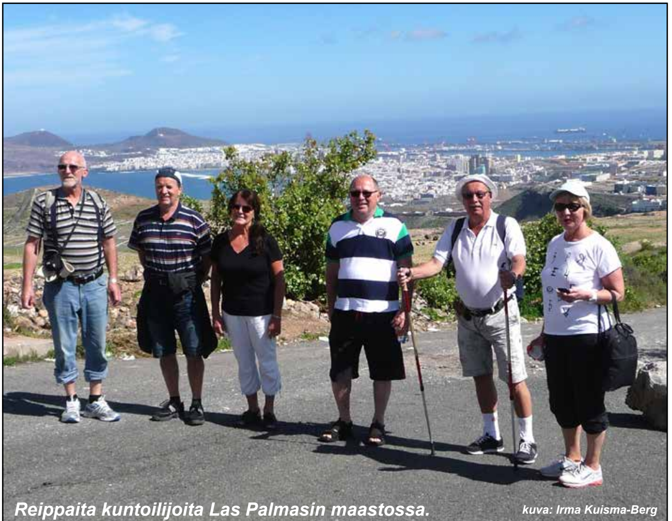
Reippaita kuntoilijoita Las Palmasin maastossa.