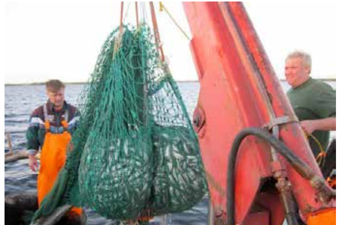
Jussi Laukkanen ja muikun nostaja Orimattilasta, joka toimi myös apumiehenä.

Kalastaja Jyrki Hatanpää omistaa kaksi troolauksen venettä. Päijänne on iso ja niin ovat muikun troolaukseen veneiden lisäksi tarvittavat muut tarpeelliset `vieheet`. Troolin lasku on kiehtovaa katsella. Kaksi troolia lähtee rannasta, selkävesille päästyä alkaa veneiden erkaneminen ja alkaa 300 metriä pitkän – minä sanon verkon – troolivieheen alasajo. Venhot erkautuvat toisistaan ja miehet heittävät pieniä ja yhä isompia ja isompia poijuja veteen. Troolin (pyydys?) leveys on 160 metriä. Sitten ajetaan Päijänteellä aukot auki hissun kissun veneessä olevalla monitorilla kalaparvien liikkeitä seuraten ja kurssia vaihtaen. Yläparvi, alaparvi, joukkio jossain lähellä vieheen suunnassa. Jännää. Saaliin ylösvedon hetki koittaa. Jännitys kasvaa, lokit pyörivät ja enteilevät kunnon saalista. Muikkuja on enemmän kuin koskaan olen nähnyt samanaikaisesti. Lähes 400 kiloa kerta-ajolla parin tunnin silmään.