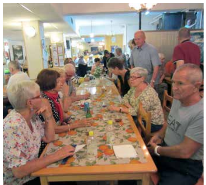
Suomi-Kerhon sali oli täytynyt kun he saivat nauttia paikallisesta musiikkiesityksestä keskiviikkoillan tansseissa.