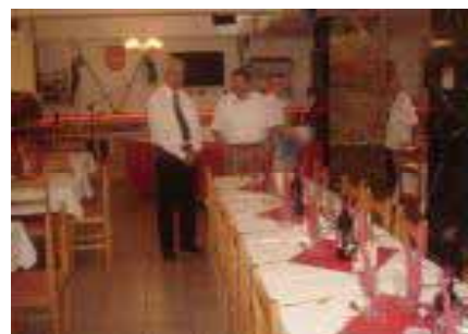
Aluksi näytti tyhjältä....