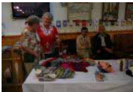
Aavikon ruusujen pöydän tarjontaa.