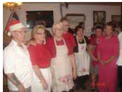
Keittiön väkeä kiitettiin....