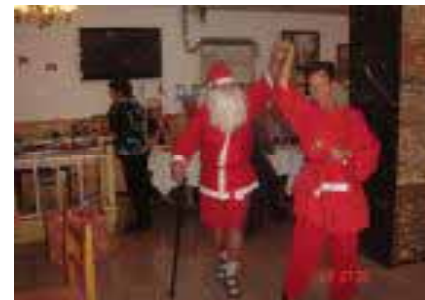
Pukkia vietiin niin....