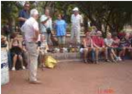
Palkintokoroke ja tuomarit.