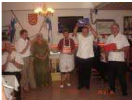
Biljardin kinkkupalkinnot jaettiin.