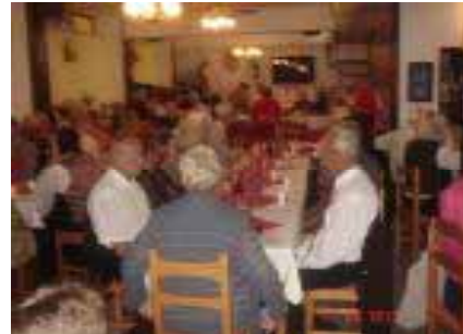
Sitten tupa tuli täyteen....