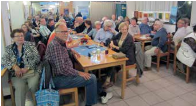
Yleisö seurasi tiiviisti kilpailua.