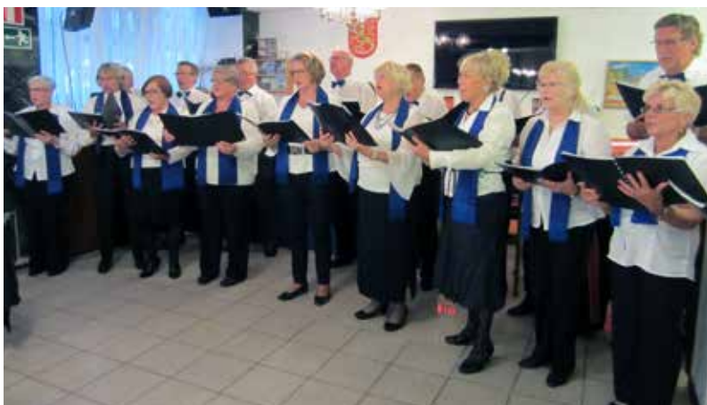
Suomi-Kerhon kuoro Sunnuntaimatineassa 26.1.

teksti Marja Puuska