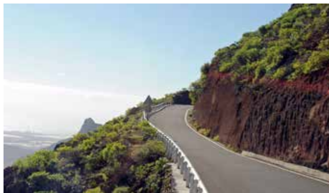
Kuva matkan varrelta vuoriston mutkikkailla teillä.