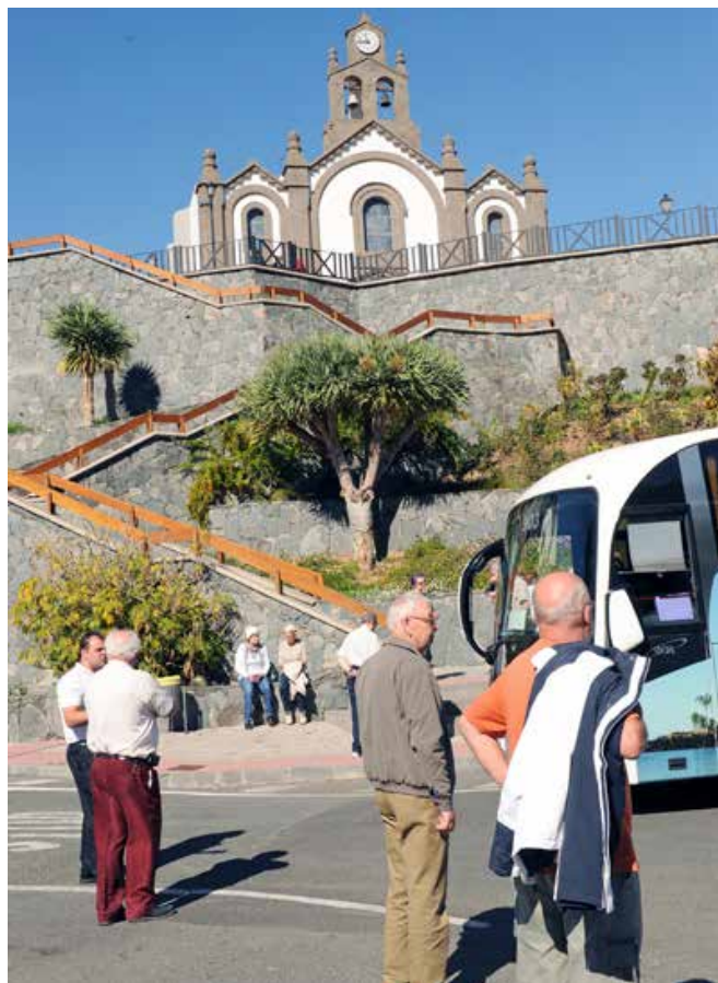
Kuva Santa Lucian kirkon edestä pysähdyspaikalta.