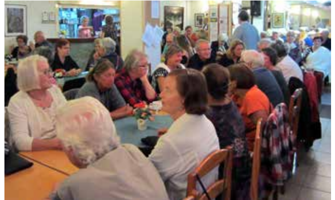
Salin täyteinen yleisö nautti korkeatasoisesta konsertista.

Tilaisuuden lopuksi kuoroa vaadittiin laulamaan vielä yksi laulu. Kuoron johtaja päätti lauluksi kuoron aiemmin esittämän Sellainen ol' Viipuri pyytäen yleisöä laulamaan kuoron mukana. Kerhotilat raikuiivat, kun Altti johti vuoroin kuoroa, vuoroin yleisöä. Kaikki lauloivat täysin rinnoin vanhan tutun laulun. Kotiinlähtö sujui iloisissa tunnelmissa tyytyväisin mielin.