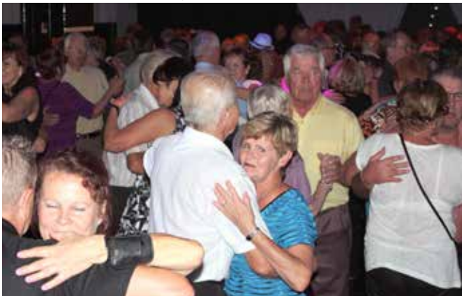
Tanssikellari Foxin parketti on täysi.

Tanssikellari Foxin ideana on olla nimenomaan tanssiravintola. Tanssitilaa on yli 100 neliötä. Musiikista vastaavat