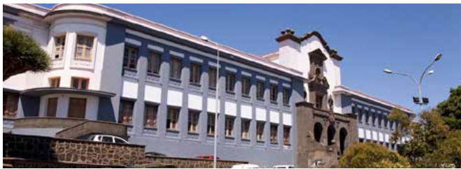
(ULL) La Lagunassa sijaitseva yliopisto.

Rakennuksen vieressä on Torres de Santa Cruz, jotka ovat korkeimmat pilvenpiirtäjät Kanariansaarilla ja korkeimmat kaksoistornit Espanjassa. Nämä maamerkit osuivatkin ensimmäisinä silmiin, kun olimme aloittaneet ajelun Teneriffan saarella.