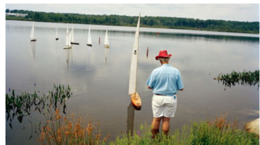
Fotografiska Tallinn - valokuvanäyttely

Vastuullinen matkanjärjestäjä: Kuopion Tila-Auto Oy (0894/04/mj) Jaana Neuvonen p.044 768 1818