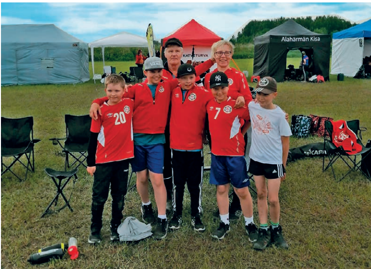
Kajastuksen D-juniorit valmentajineen Power Cupissa.

Luolajan Kajastuksen C1-joukkue pelasi erittäin hyvin läpi koko Power Cup -turnauksen. Turnauksen aikana voitettiin jopa niitä joukkueita, joille ei ollut pärjätty kauden aikana. Kehitys siis kulkee oikeaan suuntaan.