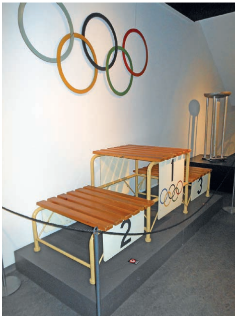
Olympiarenkaat, palkintopalli ja takana olympiatulen teline.

Kiitokset Hämeenlinnan kaupunginmuseolle sekä kaikille näyttelyn toteutukseen osallistuneille ja näyttelyesineitä lainanneille!