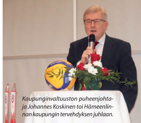
Kaupunginvaltuuston puheenjohtaja Johannes Koskinen toi Hämeenlinnan kaupungin tervehdyksen juhlaan.

Ansiomerkkien jaon jälkeen jaettiin Kajastuksen uudistettu pöytästandaari kahdeksalle pitkäaikaiselle yhteistyökumppanille ja tukijalle. Se oli samalla uuden pöytästandaarin julkistamistilaisuus. Pöytästandaarin saivat Hämeenlinnan kaupunki, Hämeenlinnan Liikuntahallit Oy, Suomen Lentopalloliitto, TUL, Hämeenlinnan Järjestösäätiö, Rakennusliitto osasto n:o 100 ry, Hämeenlinnan maalarit ja mattomiehet os. 26 ja Metalli 43 (Hämeenlinnan metallityöväen ammattiosasto).