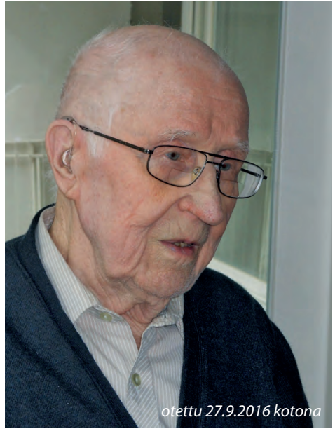
otettu 27.9.2016 kotona