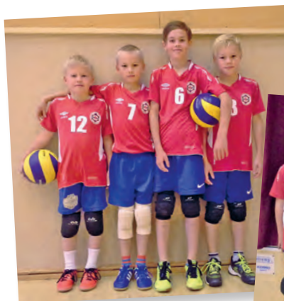
Kajatuksen E-junioireita – nuorempi ja vanhempi ryhmä.