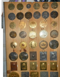
Osa Repan mitalaista.