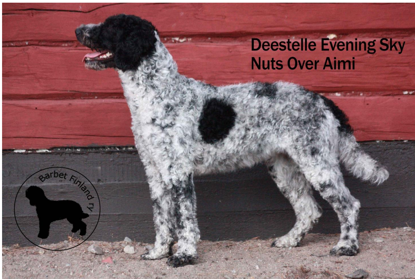
Deestelle Evening Sky Nuts Over Aimi