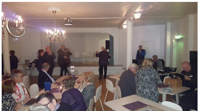
Juhlaväkeä Kaamoksen kaatajaisissa, paikkana Ratapihan Ruustinna Kemissä

- Kaamoksen kaatajaiset yhdessä LC Kemin kanssa 11.1.2020