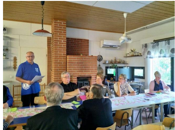
Kauden aloitus Ajoksessa, Koivurannan majalla, yhdessä LC Kemin kanssa.

Kuukausitapaamisia pidettiin 7 kertaa, hallituksen erillisiä kokouksia 1 kerran. Kauden avauskokous järjestettiin yhdessä LC Kemin kanssa Ajoksessa, Koivurannan majalla.