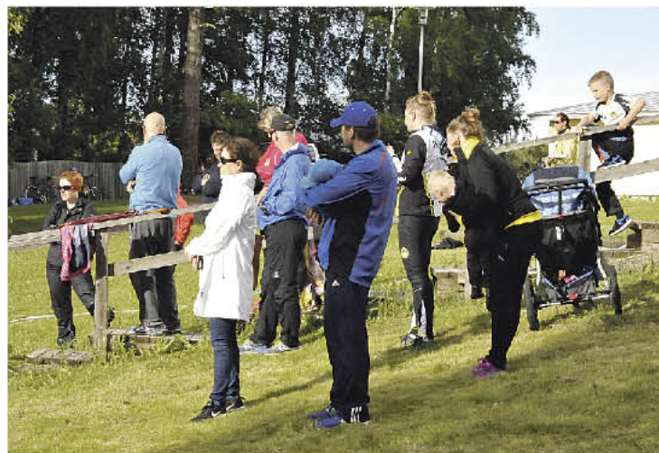
Kisaajat saavat vakiojoukolta kannustusta. Monella olisi itekin mieli mukaan, mutta aina se ei onnistu.