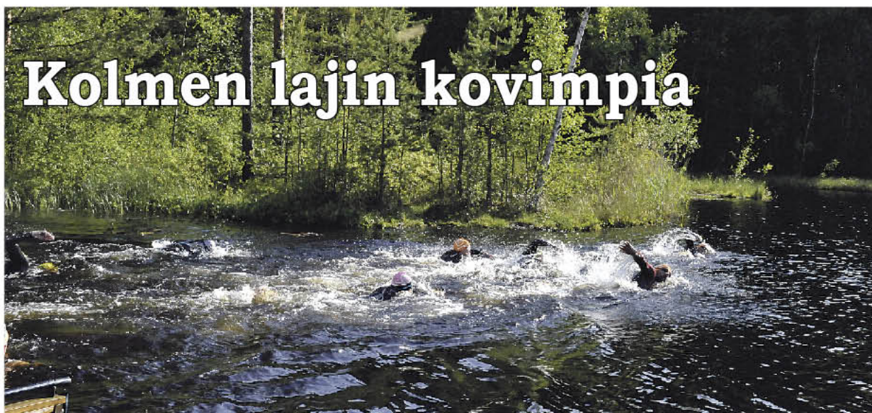
Varsinkin vastavaloon on pienenkin joukon triathlonin yhteislähtö komeaa katsottavaa.

Noin kaksi vuotta on Valkealan Kajossa aktiivisesti toiminut triathlonijaosto. Erittäin vaatavassa lajissa on yllättäen mukana väkeä perheittain.