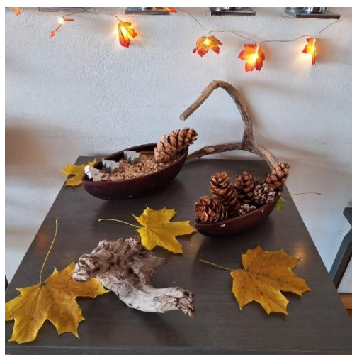
Tunnelmia syysleiriltä.