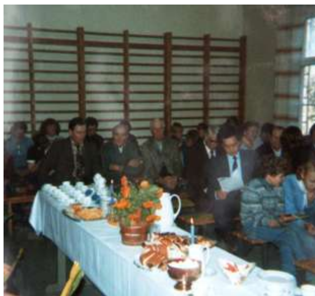
Avajaisjuhlataunnelmaa vuodelta 1982