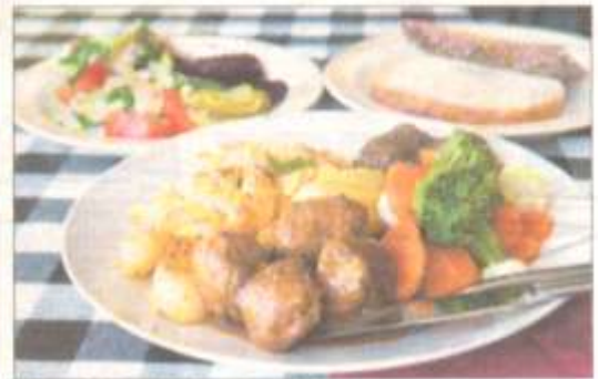
Noutopöydän antimet maksavat 7 euroa.