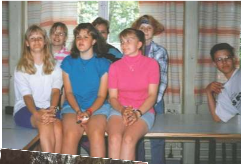
Yllä: 90-luvun rippileiriläisiä

Yksi vilkkaimmin kylällä toiminut on Teiskon seurakunta, joka on pitänyt koululla lennökkikerhoa, pyhäkoulua, kinkereitä ja seurakuntapiiriä. Lisäksi rippikoululeiri järjestettiin Kaanaassa vuonna 1991.