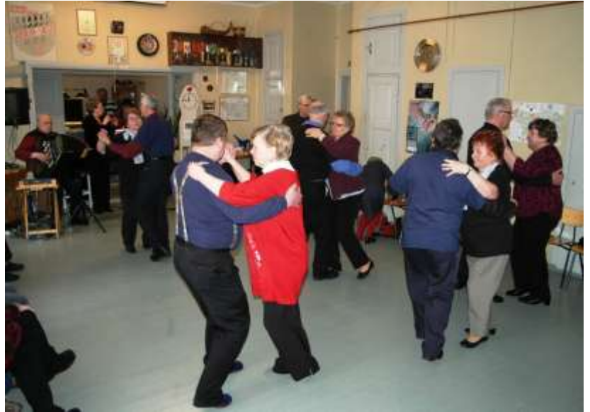
Yllä: Kellonkääntäjien tanssahtelua

Tampereen tuoreessa maaseutuohjelmassa yhteisöllisyyden kärkihankkeena mainitaan yhteisöllisen toiminnan mahdollisuuksien edistäminen pitkäaikaisilla, kestävillä ja selkeillä tilaratkaisuilla, ja vastuutahoksi on nimetty tilakeskus. Investointien lisäksi koulun jatko asukaspohjaisessa käytössä vaatisi yhteiskäytön lisäämistä alueen toimijoiden kanssa. Kaanaan kohdalla asia kytkeytynee tiiviisti ilmailu- ja moottorikeskuksen kehittämishankkeeseen, joka on myös yksi ohjelman kärkihankkeista.