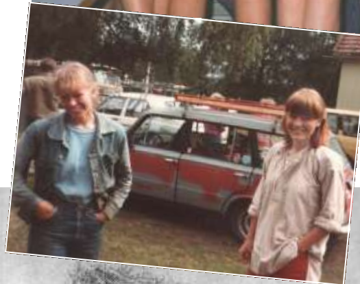
Vasemmalla: 80-luvun ympäristöleiriläisiä