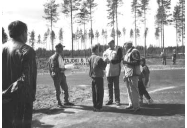
Yllä: kylätoimikunta luovuttaa lahjoittaa kiertopalkinnon avajaisissa

Seuraavana vuonna kyläyhdistyksen rooli laajeni moottorikeskuksen tapahtumissa,