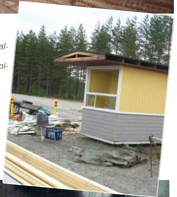
Oikealla: Melkein valmis lippukoppitalkoiden tulos vuodelta 2006.

Talkoilla tekemisen perinne on elänyt Kaanaassa vahvana. Jos jotain ei ole ollut tai haluttu lainata, on tartuttu toimeen ja tehty itse. Talkoilla on hoidettu monituisia tapahtumia, luotu puitteita liikkumiseen, ylläpidetty taloa, hankittu varoja ja niin edelleen. Ensimmäisiä kylätoimikunnan hankkeita oli kentän tekeminen pelejä ja tapahtumia varten. Yllä olevissa kuvissa on rivissä on kentän talkooväkeä ja talkoissa käytettyä kalustoa. Alla taas järjestetään kentälle jäät talvitapahtumaa varten. Talkoolaisten iloisista ilmeistä päätellen talkootyön äärellä on myös viihdytty.