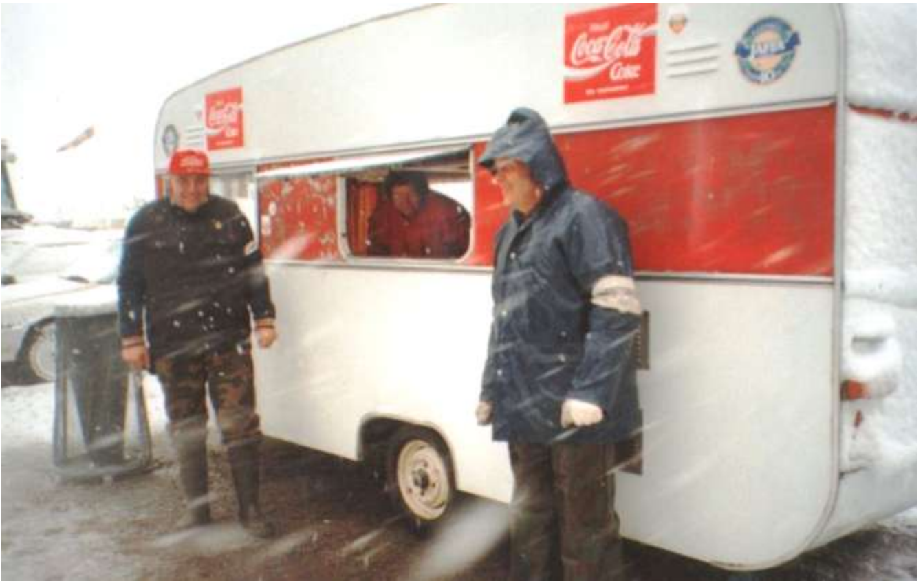
Kioskivaunu oli rata-alueen lämmin kahvikeidas tuulessa ja tuiskussa.

ja siivousta. Karting-radan avajaisia vietettiin elokuussa 1993 ja kylätoimikunta lahjoitti pokaalin kiertopalkinnoksi. Kyläyhdistys on ollut kartingtapahtumissa mukana, kuten myös vuoden 1999 SM-kisoissa. Niinikään Speedwayn MM-finaali vuodelta -95 on tallentunut kylätoimikunnan leikekirjaan yhtenä mieleenpainuvana talkootapahtumana. Yhteistyö eri lajiseurojen kanssa erilaisissa moottoriurheilukeskuksen tapahtumissa ja kilpailuissa on jatkunut aktiivisena näihin päiviin saakka, siis kunniakkaasti lähes 30 vuotta. Järjestyksenvalvontatehtäviin on koulutettu tänä aikana n. 60 henkeä ja lipunmyyntitehtäviin on kasvanut jo uusi sukupolvi. Mainittakoon vielä, että Suomen suurin kansallinen autourheilukisa Kardanikunkku on ajettu Kaanaassa yli 20 kertaa ja suunnistustapahtuma Jukolan viesti kaksi kertaa. Paikalla on vierailut myös autourheilun ”maailman-tähtiä”: Mika Häkkinen, Kimi Räikkönen ja Mikko Hirvonen.