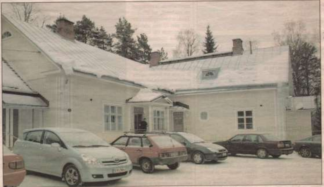
Kokoonumispaikka on kylän henkisellem elämälle tärkeä. Kaanaan koululla kokoontuu joka viikko nuorten 4H-kerho ja eläkeläisten jumpparit.