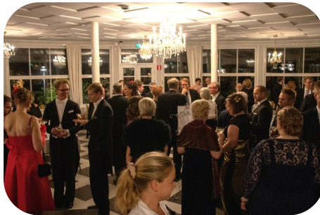
Kuva VTS100-juhlasta

Lämpimästi tervetuloa Vaasan Teknillisen Seuran 105-vuotisjuhliin, jotka järjestetään lauantaina 19.10.2024 klo 18 alkaen. Juhlapaikanamme on tällä kertaa Bacchus & Svenska Klubben, Svenska Klubbenin juhlasali (Rantakatu 4, Vaasa, käynti sisäpihan puolelta). Kutsu kahdelle. Frakki tai tumma puku.