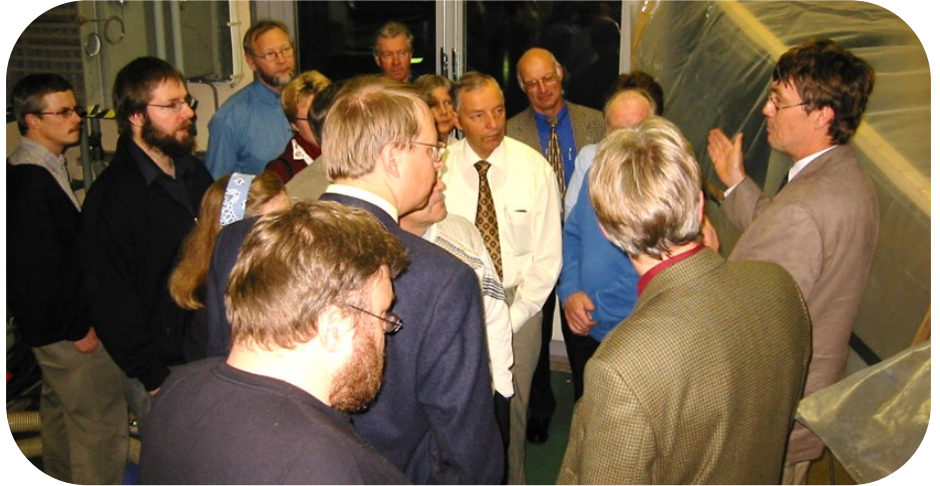
VTS tutustumassa Vaasan Veden toimintaan syyskuussa 2003

kautta tai ottamalla yhteyttä jompaankumpaan ilmoittautumisvas- taavaamme.