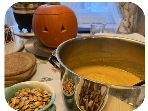
Vuoden 2023 nuukan Halloweenin ohjelmassa oli kurpitsakeiton ohje

mennessä webbisivujemme tämän tilaisuuden kohdalta löytyvän Google Forms -lomakkeen kautta tai ottamalla yhteyttä jompaankumpaan ilmoittautumisvastaavaamme.