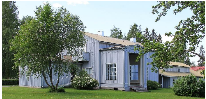
Villa Väinölä.

Menomatkan varrella Kuortaneella näemme Alvar Aallon syntymäkodin . Alajärvelle saavuttuamme tutustumme Alajärven nuorisoseuran taloon , jonka Aalto suunnitteli opiskeluaikanaan 1919. Vierailemme veljelleen asuintaloksi 1926 suunnittelemassa Villa Väinölässä sekä Alajärven Vanhassa kunnansairaalassa (1929).