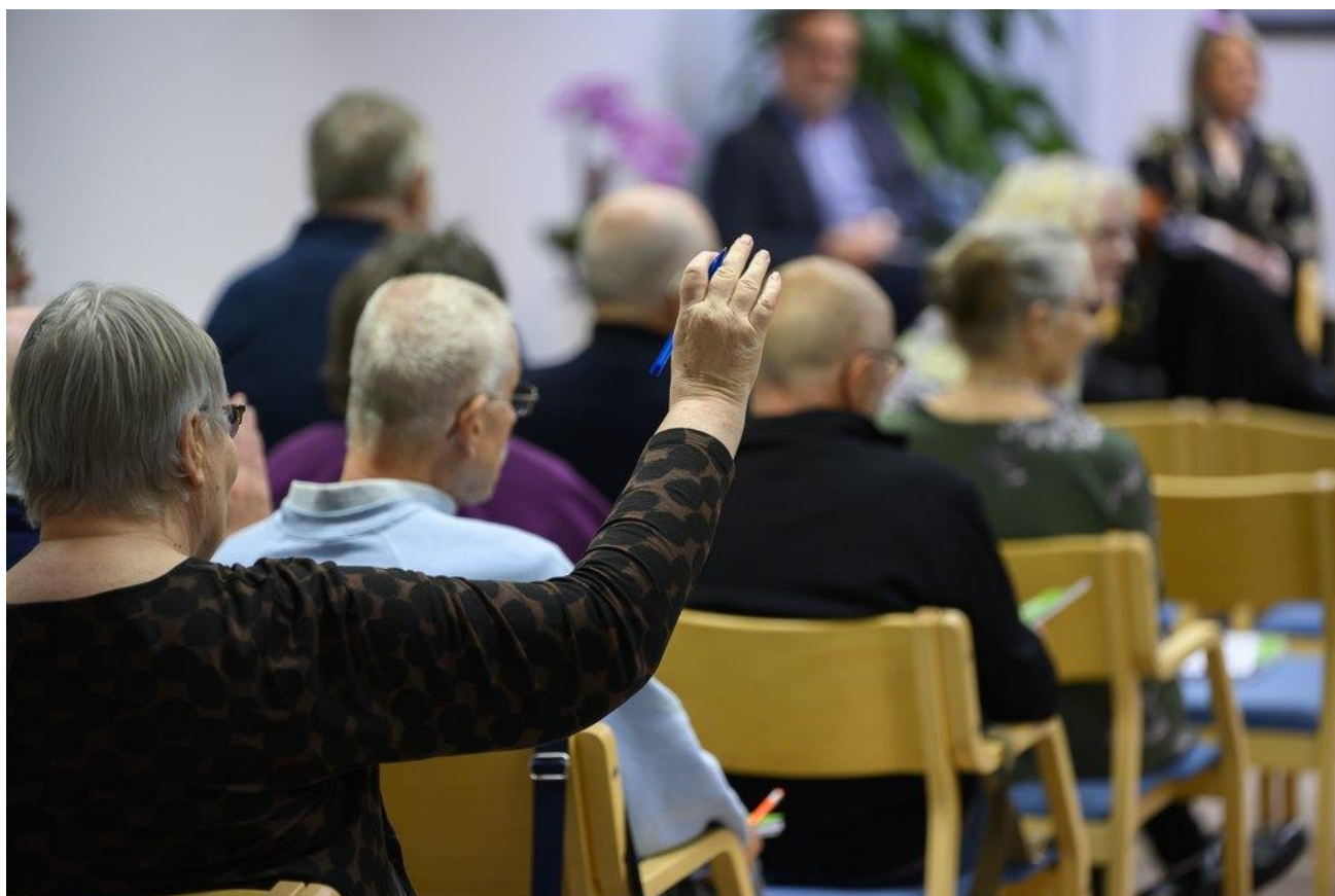
Laulun aika -tilaisuus Espoossa syyskuussa 2022.