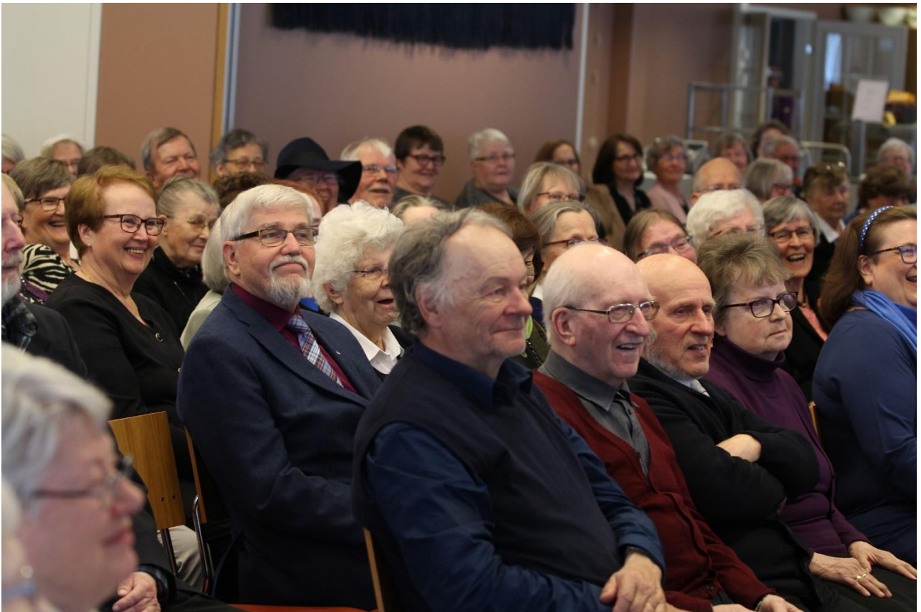
Kevätjuhlatunnelmaa Jyväskylässä 2018.