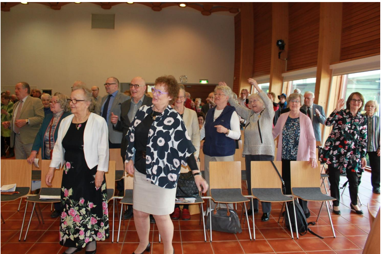
Kevätjuhlatunnelmaa Kouvolassa 2019.