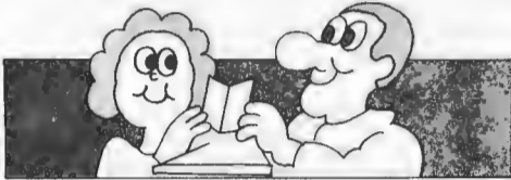
Jokainen STS:n konttori on omasi.