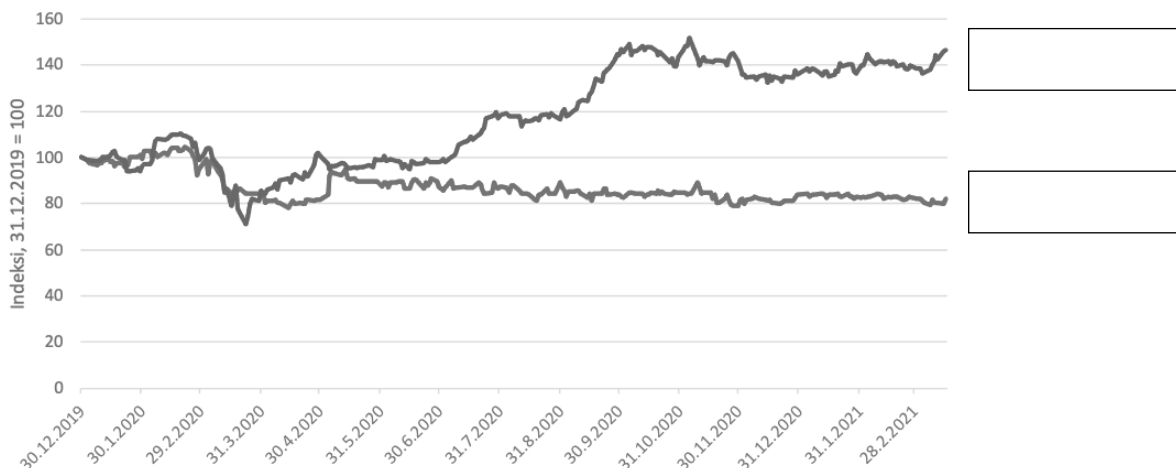
Viking linen ja Keskon osakkeiden hinta