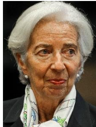
Christine Lagarde Euroopan keskuspankin pääjohtaja