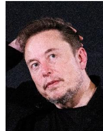
Elon Musk X:n pääomistaja