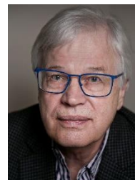
Bengt Holmström taloustieteen Nobel-palkittu