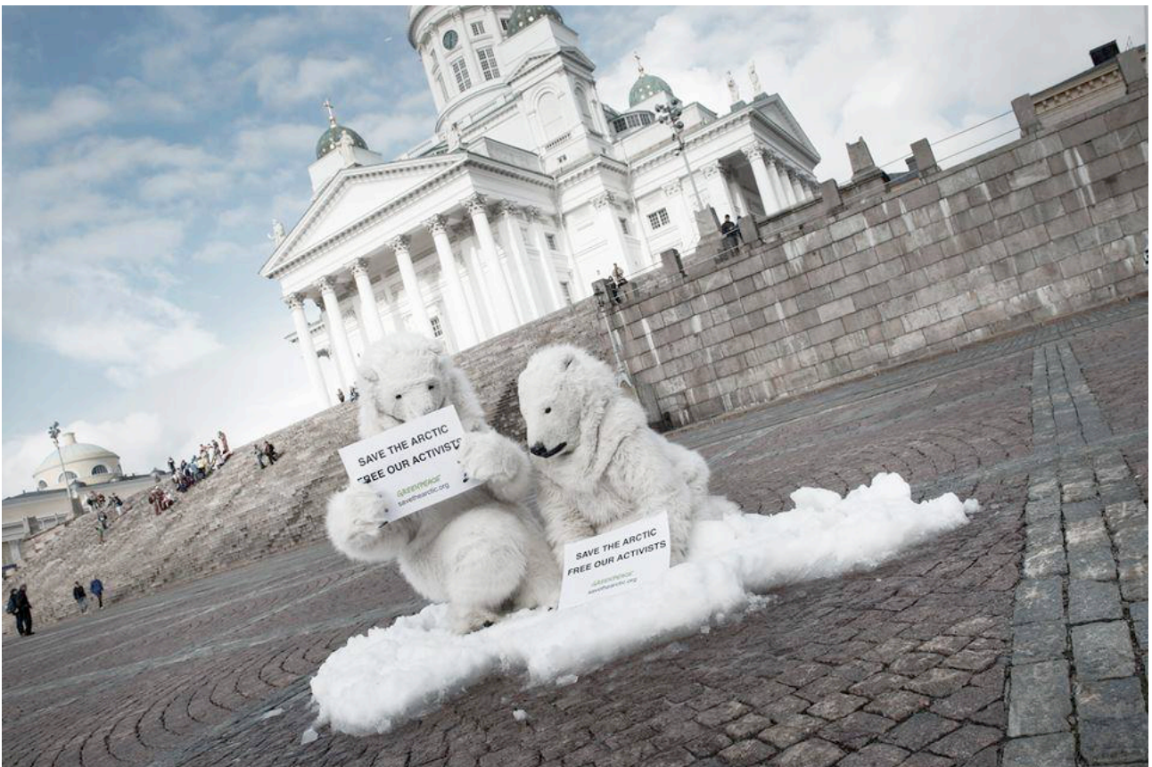
Jääkarhut laputtavat vangittujen Greenpeace-aktivistien vapauttamiseksi. Kirjoittaja vasemmalla.

Olen nähnyt Grönlannissa ja Pohjois-Kanadassa, Pohjois- ja Länsi-Siperiassa kyliä ja yhteisöjä, jotka ovat jääneet paitsi viina- myös huume koukkuun. Taistelu on kovaa. Erään lentoaseman kallisarvoinen, vasta saapunut huumekoira ei ehtinyt kotoutua, kun se jo löytyi ammuttuna.