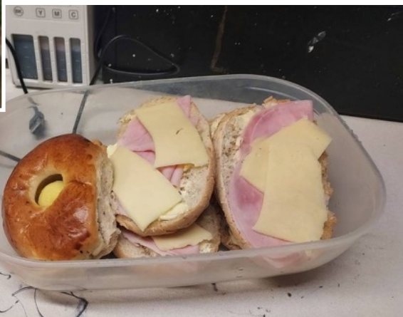
Osa työhyvinvointia voi olla maittavat eväät.