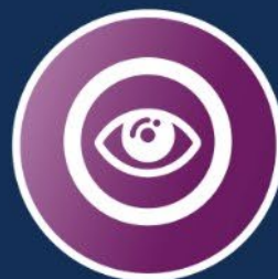
Näkökyky 39 miljoonaa