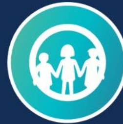
Nuoriso 3 miljoonaa