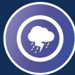
Hätäapu 4 miljoonaa