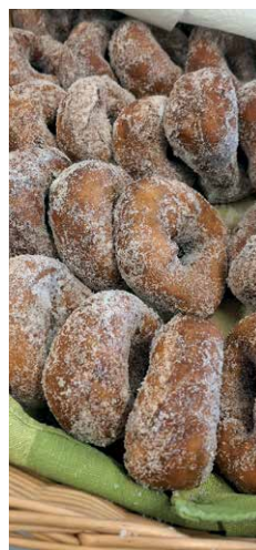
Munkkeja valmistui reilut 300 kpl. Myös gluteenittomia oli tarjolla.