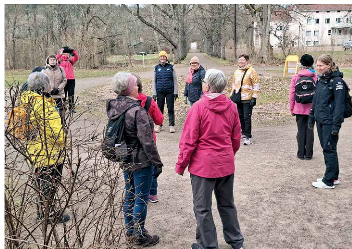
Martat Ankkapurhan virkistyspäivän puistokävelyllä.