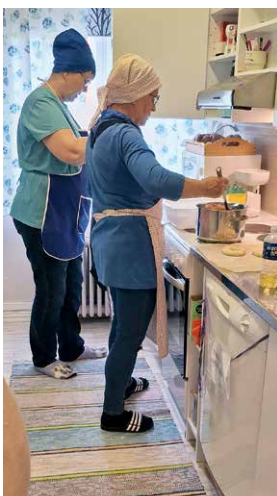
Puljulla tehtiin munkkeja vappuaattona.