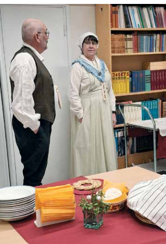
Elimäen piika ja renki olivat kertomassa kokemuksia pestistään helmikuussa "Martan soppapöytä" -illussa.