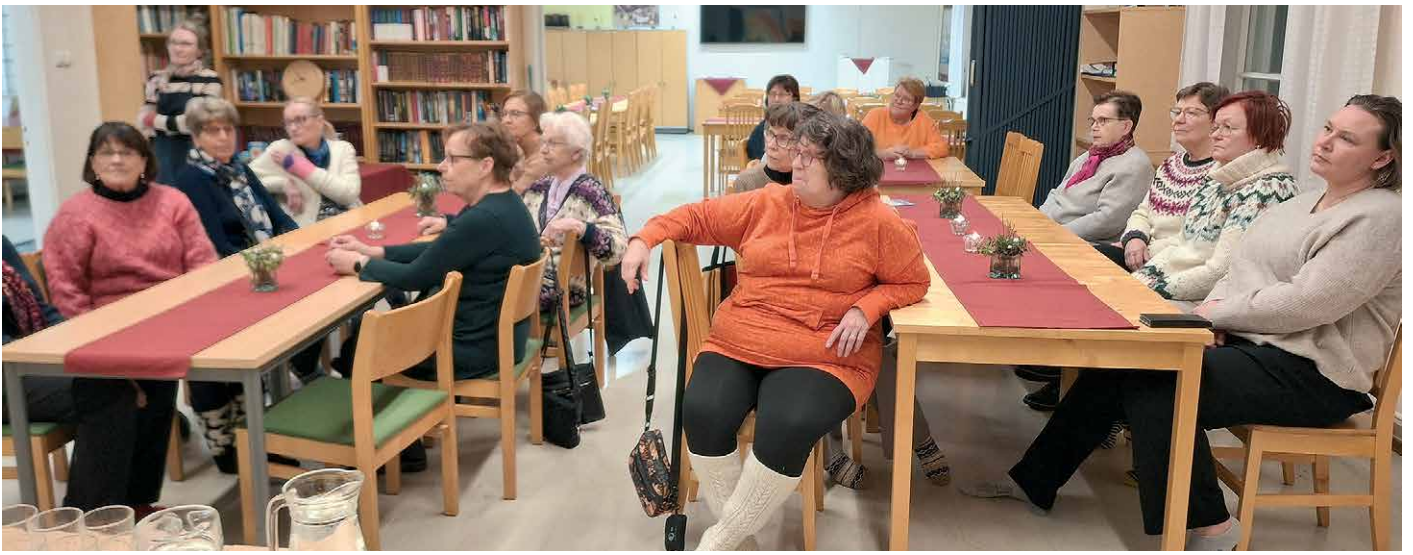
Marttoja ja marttailusta kiinnostuneita "Martan soppapöytä" -tapahtumassa.