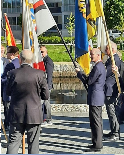
kuvernööri-elle kuvernööri Pir

Tulevan kauden 2025-2026 lle muiden kanssa. Kautensa päättävä pumarssi päättyi vuosikokouspaikalle.