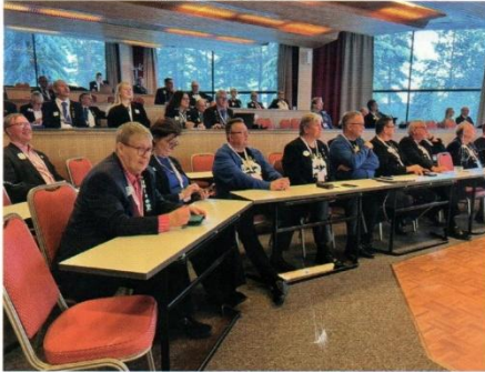
Kuvernöörineuvoston kokouksessa päätettiin muun muassa rauhanjulistikilpailun Suomen ehdokas äänestyksellä.

Kangasaho kertoi myös G-piirin tämän syksyn jäsenkehityksestä, joka on siirtynyt positiiviselle puolelle. Jyväskylän kuvernöörineuvoston järjestäjäklubit olivat LC Pihtipudas, LC Pihtipudas/Emmit ja LC Karstula/Sirkat.