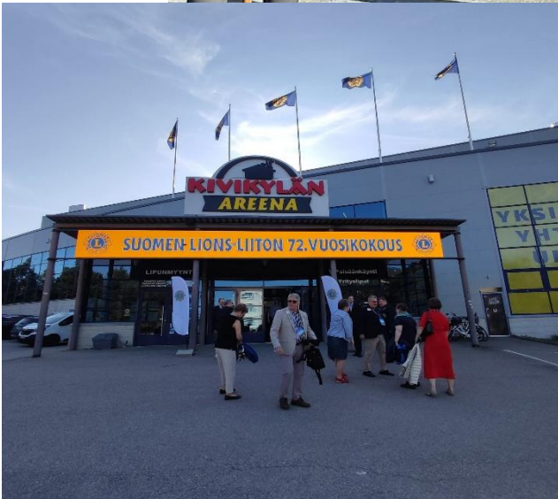
Kivikylän Arena toimi vuosikokouksen paikkana.

Tulevan kauden 2025-2026 lle muiden kanssa. Kautensa päättävä pumarssi päättyi vuosikokouspaikalle.