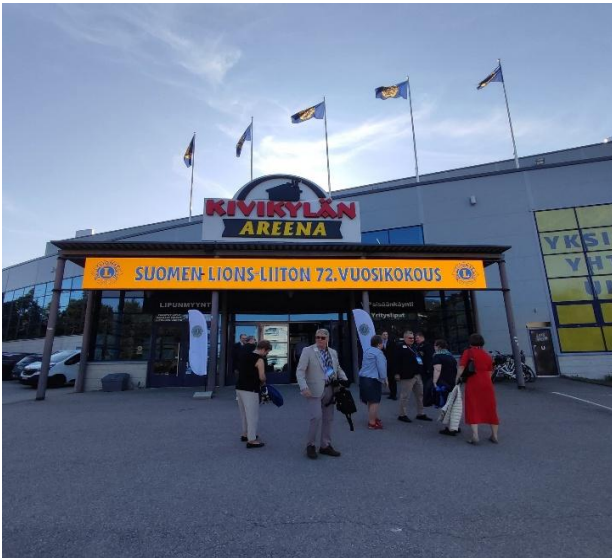
Kivikylän Areenassa ruokailut ja iltajuhla vuosikokouksen aikana.