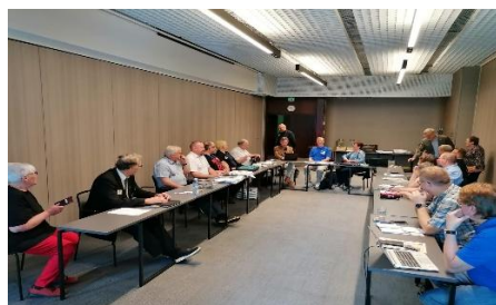
Järjestäytymiskokous oli 25.5.2024 Turussa,