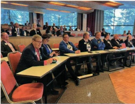
Kuvernöörineuvoston kokouksessa päätettiin muun muassa rauhanjulistikilpailun Suomen ehdokas äänestyksellä.

Kangasaho kertoi myös G-piirin tämän syksyn jäsenkehityksestä, joka on siirtynyt positiiviselle puolelle. Jyväskylän kuvernöörineuvoston järjestäjäklubit olivat LC Pihtipudas, LC Pihtipudas/Emmit ja LC Karstula/Sirkat.