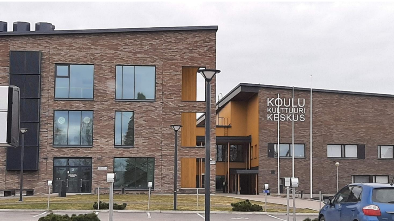
Piirin vuosikokous pidettiin Saarijärvellä la 26.4.2025 Saarijärven Koulu- ja kulttuurikeskuksessa. Järjestävä klubi oli Lions Club Saarijärvi/Palvasalmi,