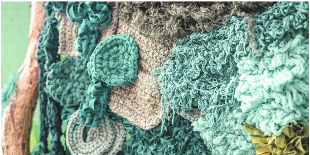
Kierrätyslångasta virkattu puu utopiahuoneessa.

Loppujenlopuksi, kun kaikki oli tehty ja valmista, oli tuloksena mielenkiintoinen, vaikuttava tapahtuma mikä toteutettiin vain muutamassa kuukaudessa alle kymmenen henkilön voimin. Jotkut oppivat ehkä uutta ja jotkut tekivät sitä mitä jo tiesivät, mutta kaikille varmasti tuli uutta kokemusta monista asioista niin ryhmänä kuin yksilönä siitä, miten monimutkainen ja rikastuttava tapahtuman tekeminen voi olla.