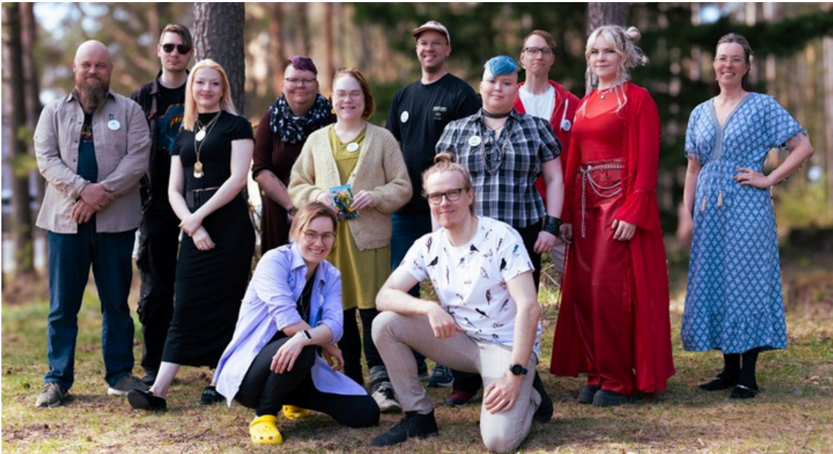
Työkokeilijaryhmän avajaispäivä toukokuussa 2025.

Futopia -yhteisöprojektin toteutti kahdeksan hengen työkokeilijaryhmä ja Kukoista! -hankkeen työntekijät 2.3.-28.5.2025 välisenä aikana. Ryhmä koostui eri ikäisistä kulttuuri- taide ja media-alan ammattilaisista ja alasta kiinnostuneista henkilöistä. Lopputuotteena oli monitaiteellinen osallistava näyttely, jossa teokset käsittelivät omien valintojen vaikutuksia tulevaisuuteen. Näyttely oli jaettu kolmeen osaan, josta ensimmäinen osa oli pelillinen valintahuone. Seuraava tila oli jaettu kahteen, josta toisesta löytyi luontoteemainen utopia installaatio ja toisella puolella synkempi dystopia installaatio kokonaisuus. Kolmas tila käsitteli ihmisen keskeneräisyyttä ja toiveikkuutta. Jokainen valinta on uusi mahdollisuus!