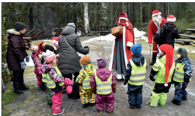
Tonttupolulla lapset tapasivat ihan oikeita tonttuja.

Vuoden päätti tonttupolku, jossa varhaiskasvatuksen ja päivä- sekä perhehoidon lapset kulkivat ryhmissä rasteilla. Paikalla oli myös joulupukki muurin kanssa. Leijonien rastina oli koti- seututalolla ongintaa, jossa onkeen tarttui jotain suu- hun pantavaa.