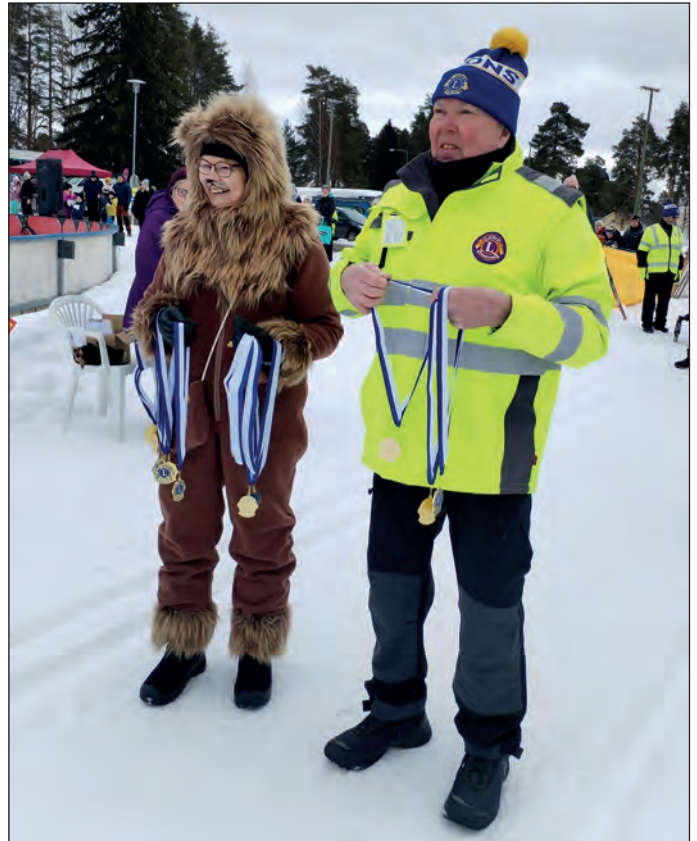
Lasten Leijonahiihto toteutettiin yhteistyössä.