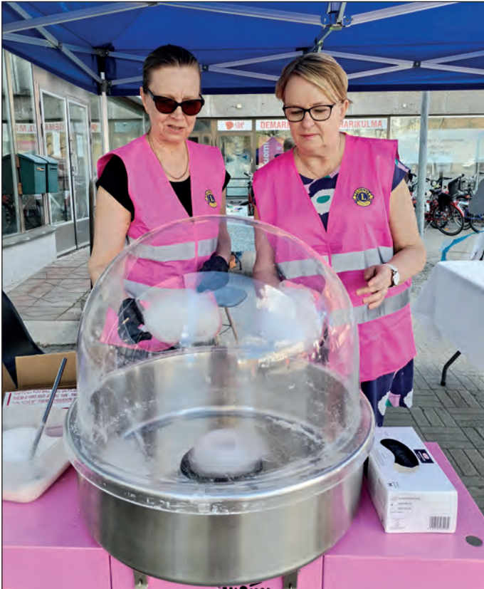
Justiinat pyöräyttelivät hattaroita Perheiden päivässä.

LC Varkaus Justiinan toiminta-ajatus on ” Auttamme ja annamme aikaamme”. Olemmekin toimineet vireästi ja aktiivisesti yhteistyössä LC Varkaus/ Koskenniemen sekä varkautelaisten yritysten ja yhdistysten kanssa.