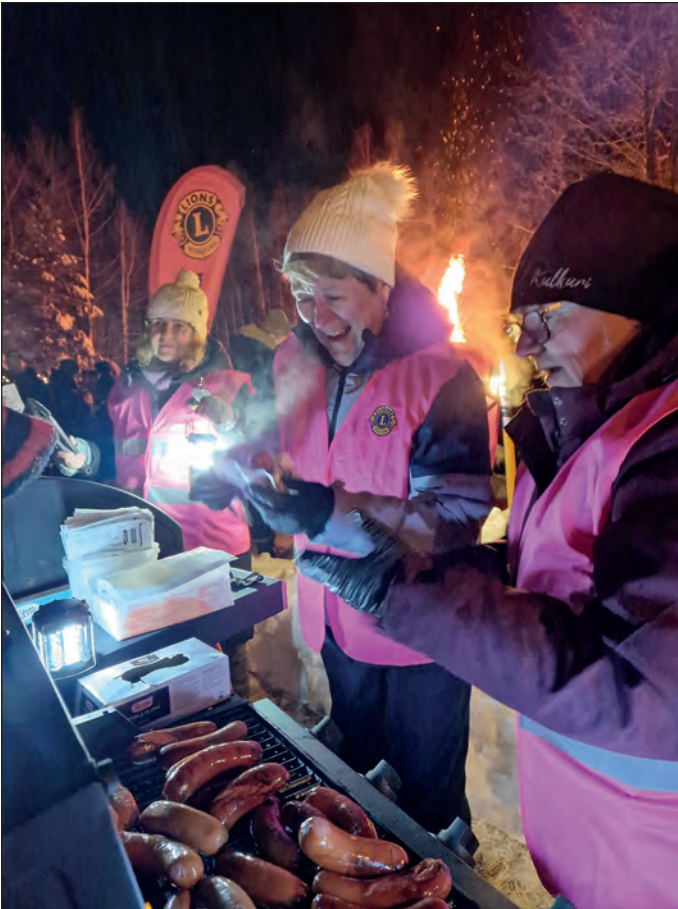
Makkaroita grillattiin ja myytiin useissa tapahtumissa.

koomme viime vuonna. Tämän vuoden puolella tiedossa on useampi jäsen lisää ja näin saamme uusia tekeviä käsiä Justiinoihin.