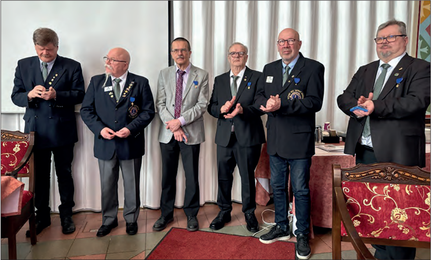
Piirin vuosikokouksessa lisäalmenassa Golden Domessa jaettiin erilaisia ansiomerkkejä.