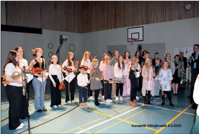
Siilinjärven konservatorion esiintyjäryhmä.

Hieman etupainotteisesti ennen ystävänpäivää soivat herkät sävelet 9.2.2025 Siilinjärven Hamulankoulussa, konserttien järjestäjänä jo vuodesta 2011 lähtien LC Siilinjärvi/Sandels. Nyt lavalla perinteisesti nuoria musiikin opiskelijoita Siilinjärven konservatoriosta kamarimusiikki