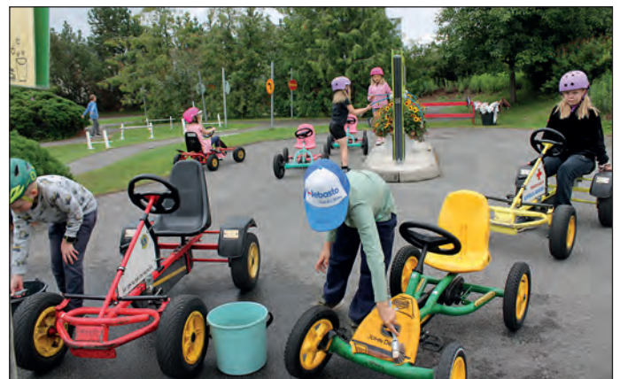
Ajon jälkeen ajokki pestiin huolella.