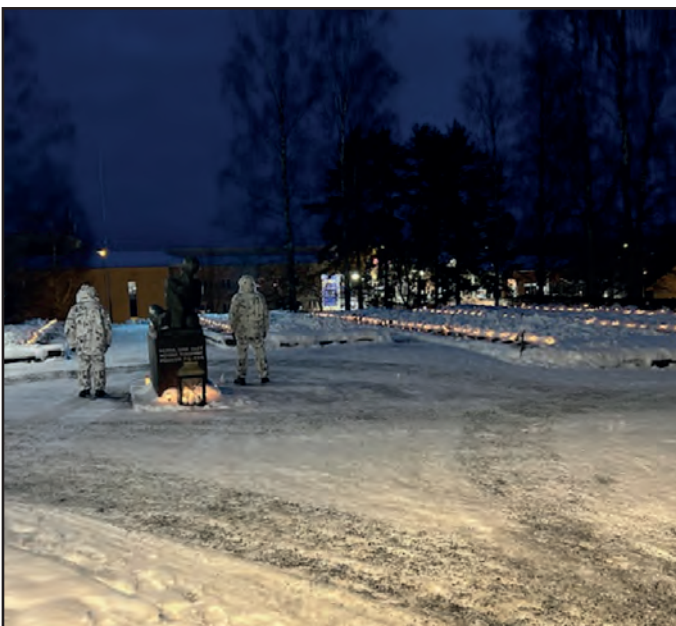
LC Kangasniemi aktiviteetti: Sankarivainajien haudoilla lumityöt itsenäisyyspäivänä, jouluna ja uutena vuotena.