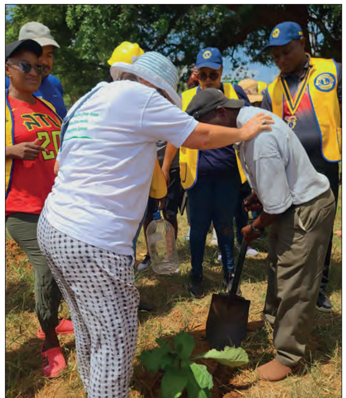
LC Iisalmi/Poroveden tulevassa ystävyysklubissa Zambiassa istutetaan myös puita.