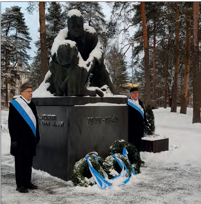
Haavoittunut sotilas -patsas sijaitsee Sankaripuistossa Kuopiossa.