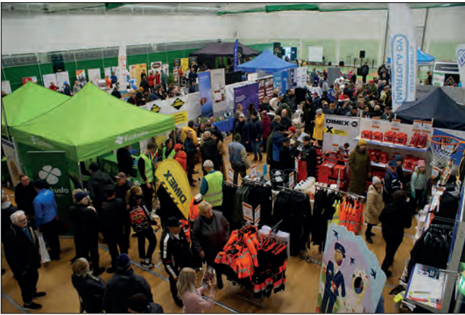
Messuilla kävi kova kuhina.