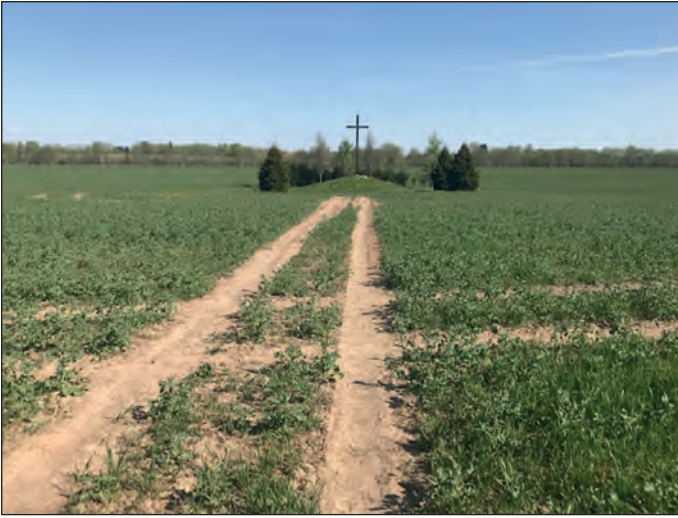
Kunniametsikön istutuksia muistoristin alueella Luunjassa. Taimet istutettu vuonna 2005

LC Suonenjoki/Soittu täytti kuluneena toimintakautena 56 vuotta. Viime kausilla toimintaamme on rajoittanut mm. korona. Leimaa antava toimintaamme on ollut myös Ukraina. Olemme avustaneet ukrainalaisia niin Ukrainaan kuin tänne kotimaahammekin. Edellisinä kausina kalustimme asunnon ukrainalaiselle perheelle, annoimme avustusta harrastuksiin, kaminoita Ukrainaan ja osallistuimme ambulanssihankintaan. Suomalaiset, meidän vanhempamme, ovat saaneet kokea saman kauheuden, ja hyökkääjä on ollut sama kuin nyt ukrainalaisilla, nimi vain on muuttunut. Osittain tästä johtuen auttamishalum-