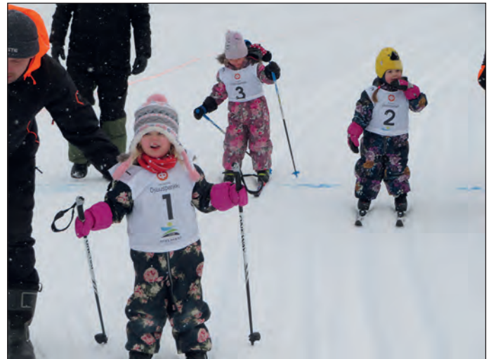
4-vuotiaanakin hiihto jo sujuu.