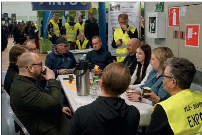
Klubilaiset jututtivat yleisöä.

Klubimme jäsenet olivat näyttävästi esillä messuilla uutukaisissa keltaisissa messuja mainostavissa liiveissä. Läsnä olleet lionit esiteltiin, minkä jälkeen me hajauduimme seurustelemaan näytteilleasettajien ja yleisön kanssa. Saimme suoraa palautetta ja samalla kerroimme lionstoiminnasta. Joustavuuttamme kiiteltiin ja rivien välistä oli