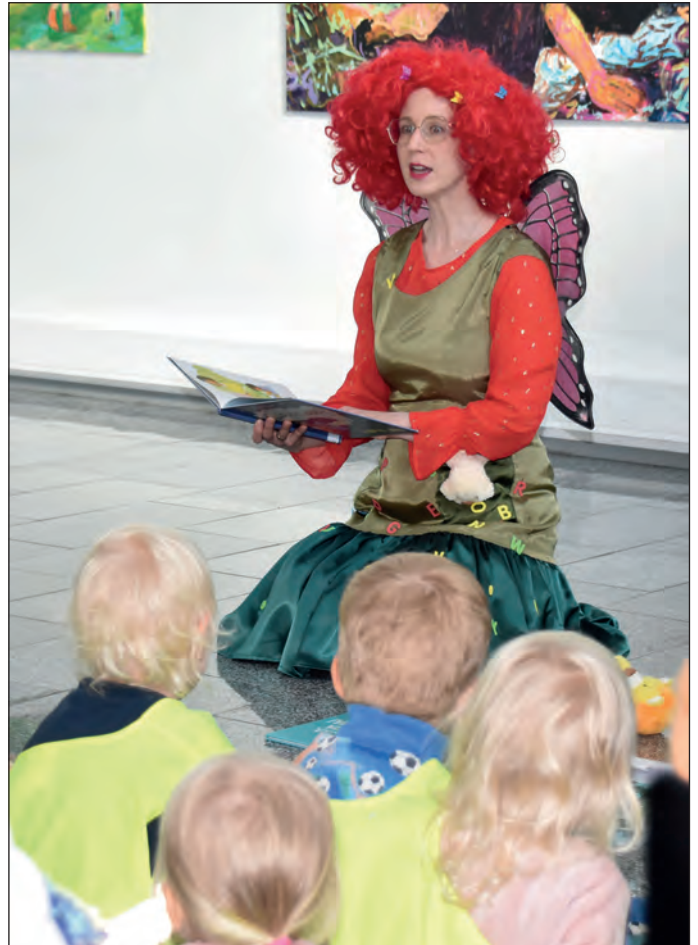
Holina-keiju luki lapsille satuja lukusalkkutapahtumassa.

Heti lukusalkkujen luovu- tuspäivän jälkeisenä päivä oli Sukevalla Hirsikankaan leirikeskuksesta lasten ke- säkauden päätös. Tänne kokoontuivat kaikki Son- kajärven päiväkotien ja perhepäivähoitajien sekä perheiden lapset. Paikalla oli melkoinen huike, kun lapset kirmaisivat ryhmis- sä rastilta toiselle. Leijonien rastina oli pallon heitto sankkoon kolmesta metris- tä ja kaikki heittäjät palkitiin lakupötköllä.