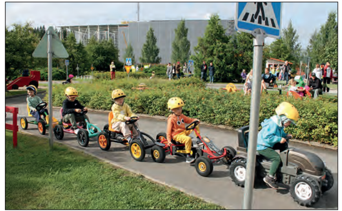
Turvaväli unohtui välillä ajon tiimellyksessä.

eri reitille käännyttyä odottivat junapuomilla. Turvavälin pito edellä ajavaan ei aina onnistunut, kun ajaminen oli niin mieluista ja vauhtikin nousi innostuksen myötä. Kolareilta sentään vältyttiin, kun leijonat olivat reiteillä ohjeistamassa ja huolehtimassa pienistä kulkijoista.