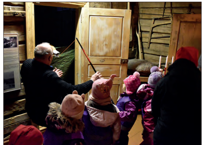
Tonttupolun ohjelmaan kuului myös jännittävä onginta.