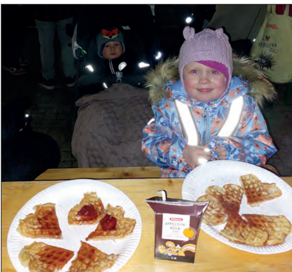
Tätä minä oon oottanu, vohvelia mansikkahillolla ja pillimehua!