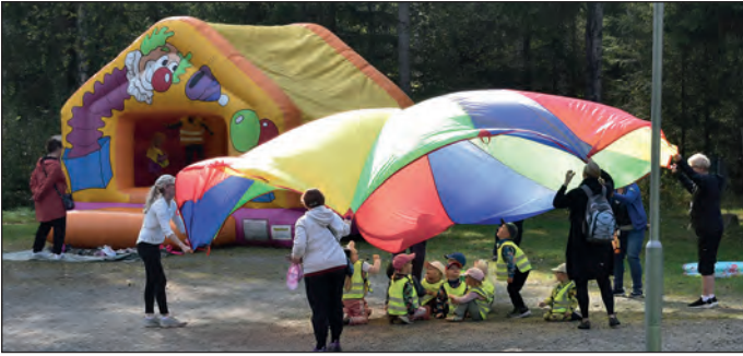
Kesäkauden päättäjaiset Hirvikankaalla.

Sonkajärvi-klubi osallistui vuoden aikana lukuisiin päiväkotij- ja esikoululais-ten tapahtumiin yhdessä muiden järjestöjen kanssa. Lionsclubin toiminta oli tapahtumissa oma pienen rastin pitäminen ja lasten palkitseminen lakupötkyllä. Ensimmäinen tapahtuma oli Lasten Leijonahiihto, joka hiihrettiin huhtikuun kolmantena päivänä ja hiihtäjiä oli tapahtumassa kuu- tisenkymmentä. Mukaan olivat tulleet myös isovan- hempiensa kanssa muuta- mat lapset, jotka eivät ole päiväkodissa tai perhepäi- vähoidossa. Tapahtuman aikaan oli hienot hankikelit ja suksi luisti ja kaikilla oli näkyvillä liikumisen rie- mua.