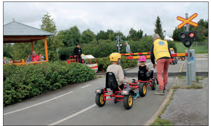
Kun punainen paloi ja puomit olivat alhaalla, täytyi junaradan edessä odottaa.

Tapahtuma järjestetään tänä vuonna la 2.8.2025 klo10-12.