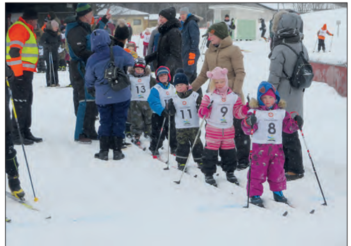
6-vuotiaat valmiina lähtöön.