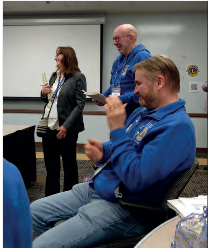
Ryhmätöiden esittelyn voi valikoiden suorittaa myös laulaen.

Koulutusohjelmat St. Charlesissa, Illinoisissa, tarjoavat tuleville piirikuvernööreille mahdollisuuden kehittää johtamistaitojaan ja saada tietoa, jota he tarvitsevat tehokkaaseen palveluun. Nämä ohjelmat ovat olleet erittäin hyödyllisiä ja tukevat piirikuvernöörien henkilökohtaista ja ammatillista kehitystä. Tänä vuonna seminaarimatka ajoittui 7.-16.2.2025, josta viimeinen vuorokausi pakkomajoituksessa Islannissa myöhässä olleen Chicago-Reykjavik -lennon vuoksi.