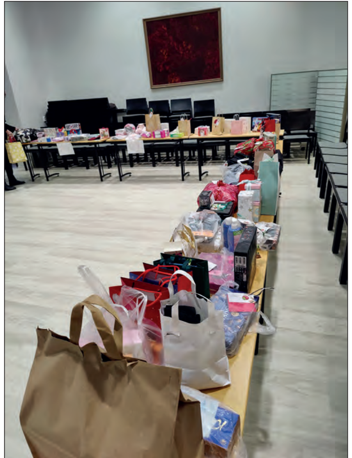
Paketteja kertyi runsaasti Joulupuu-keräyksessä Iisalmessa.

Teksti ja kuva: Sari Laine Iisalmi/Yläsavottaret