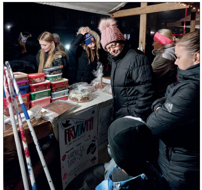
Koululaiset kartuttavat retkirahastoaan hienolla tavalla, arvostan!